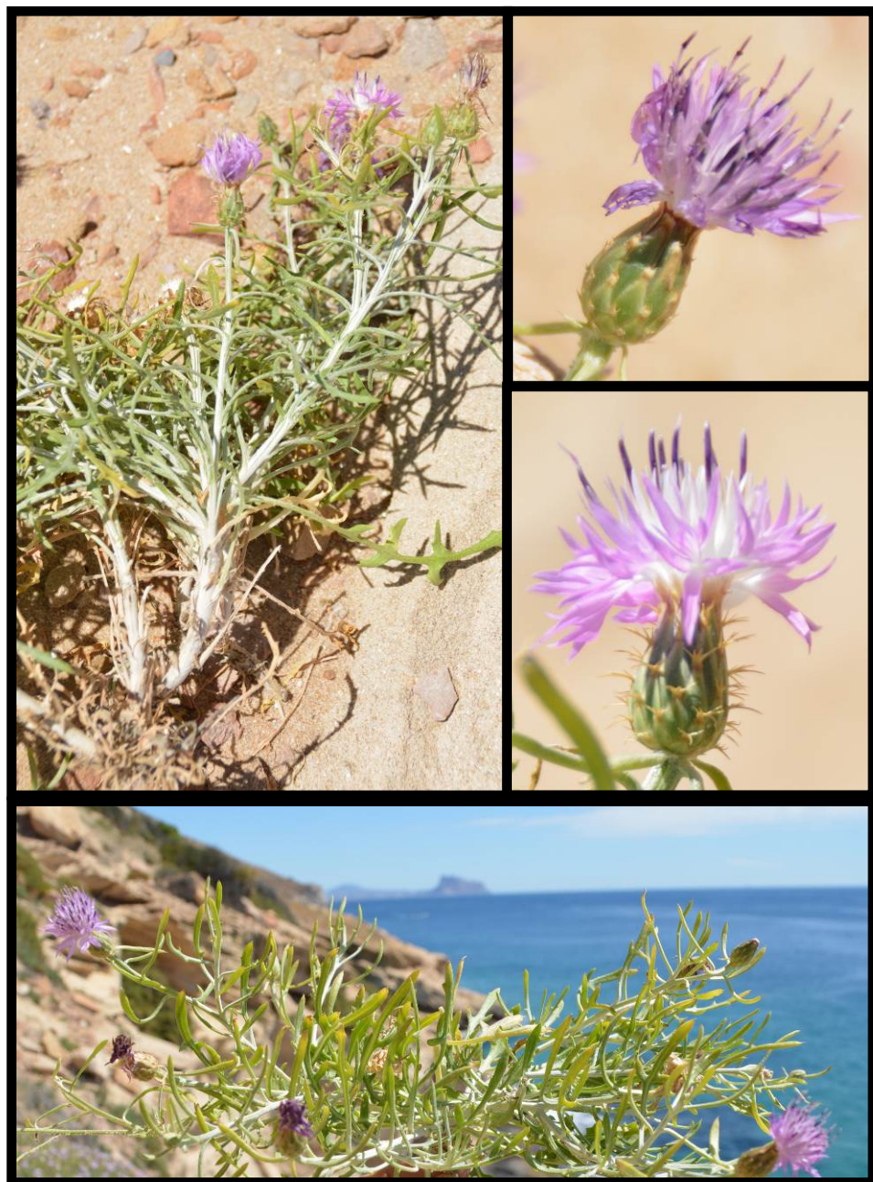
Fig. 3. Centaurea aspera subsp. geladensis (Serra Gelada, Benidorm); detalle de un fragmento de planta y de los capítulos.