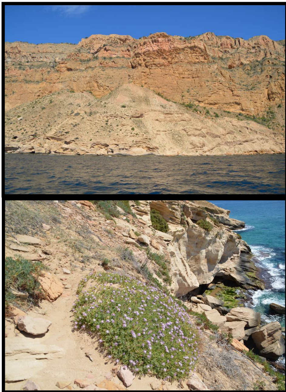
Fig. 1. Hábitat y aspecto general de Centaurea aspera subsp. geladensis (Serra Gelada, Benidorm).