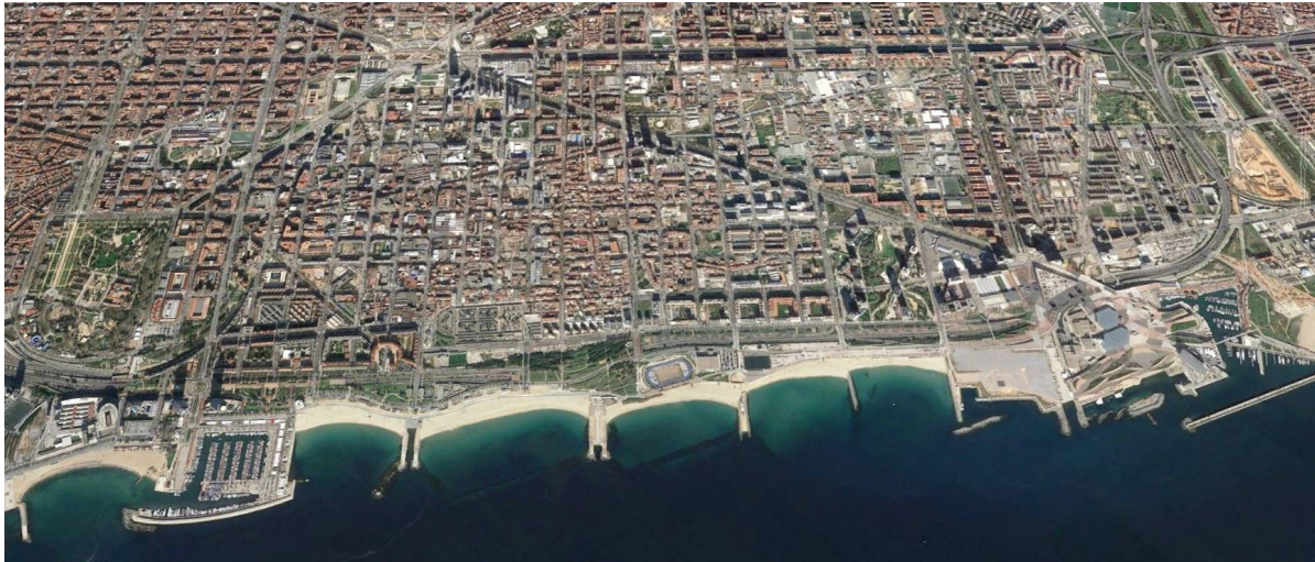
Figura 2. Frente litoral norte de Barcelona