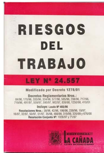
Fig. 2- Ley 24.557

El 15 de noviembre de 1995 se sanciona la ley de riesgos del trabajo y crea el sistema de riesgos del trabajo supervisado por la superintendencia de riesgos del trabajo. Crea las ART aseguradoras de riesgos del trabajo e introduce un cambio de paradigmas en cuanto al control de los riesgos y los roles de los actores involucrados. Además define las actuaciones en caso de asistencia médica y resarcimiento en caso de accidentes o enfermedades el trabajo. Establece la obligatoriedad de un seguro por accidentes y enfermedades del trabajo y prohíbe en su art. 39 que se reclamen indemnizaciones por la vía del fuero civil (artículo que años más adelante se declarararía inconstitucional) Es estado a través de las ART delega gran parte del poder policía que ejerce sobre los ámbitos de trabajo y “terceriza” en manos de entes privados con fines de lucro la supervisión y control de los ambientes de trabajo donde miles de trabajadores se exponen diariamente a agentes de riesgos que pueden afectarles la salud.