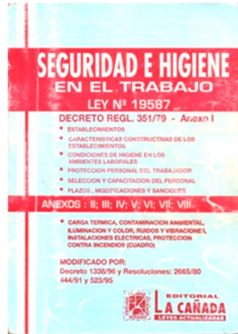
Fig. 1- Ley 19.587