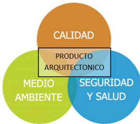
Figura 4- Sistema Integrado de Gestión

En tal sentido se considera que los contenidos y prácticas específicas en higiene y Seguridad en la construcción deben abordarse desde el concepto de mejora continua y gestión integrada de los tres sistemas, proporcionando el marco de referencias en la norma ISO 45001 para gestionar los riesgos para la salud y seguridad relacionando aspectos de calidad ISO 9001 y medio ambiente ISO 14001. El DESAFIO y la OPORTUNIDAD que se plantea es implantar tales conceptos, que muy bien se desarrollan en sistemas industrializados y procesos productivos lineales y repetitivos donde la mejora y gestión se puede medir con indicadores al finalizar cada ciclo, en una industria cambiante y dinámica como lo es la construcción en el desarrollo de un producto arquitectónico, donde repetir el mismo ciclo o proceso productivo muchas veces no se da en las mismas condiciones ya que al avanzar la obra modifica el espacio de trabajo y con ello las condiciones. Ayudando de esta manera a cumplir los requisitos legales y otros requisitos de la actividad en busca de un cambio cultural orientado a lograr los objetivos.