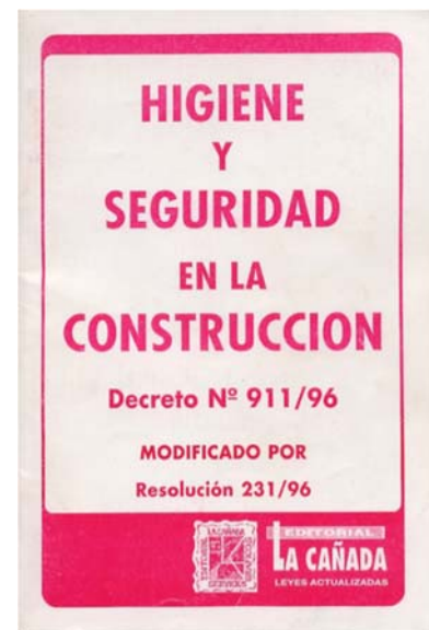
Fig. 3- Dec. 911/96

El 5 de agosto de 1996, 9 meses después de la creación de la ley de riesgos del trabajo 24.557 y ante la necesidad de regular actividades industriales que no estaban contempladas en la ley de seguridad e higiene en el trabajo 19.587 y su dec. Reg. 351/79, se crean normativas en respuesta a sectores que necesitaban una regulación específica por las características especiales de sus procesos productivos, ámbitos de trabajo y modalidades de contratación. En ese sentido se promulga el dec. Reg. 911 para la industria de la construcción. Se trata de una normativa que define derechos y obligaciones de las partes para la conformación de ámbitos de trabajos seguros y las medidas de seguridad a adoptar en cada etapa de obra. Este texto técnico brinda precisiones para la salud y seguridad de los trabajadores, abordando tanto las instalaciones de obra, los elementos de protección personal, las protecciones colectivas, los aspectos de organización, documentación y registros.