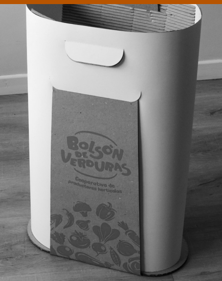
Envase armado, listo para llevar con verdura