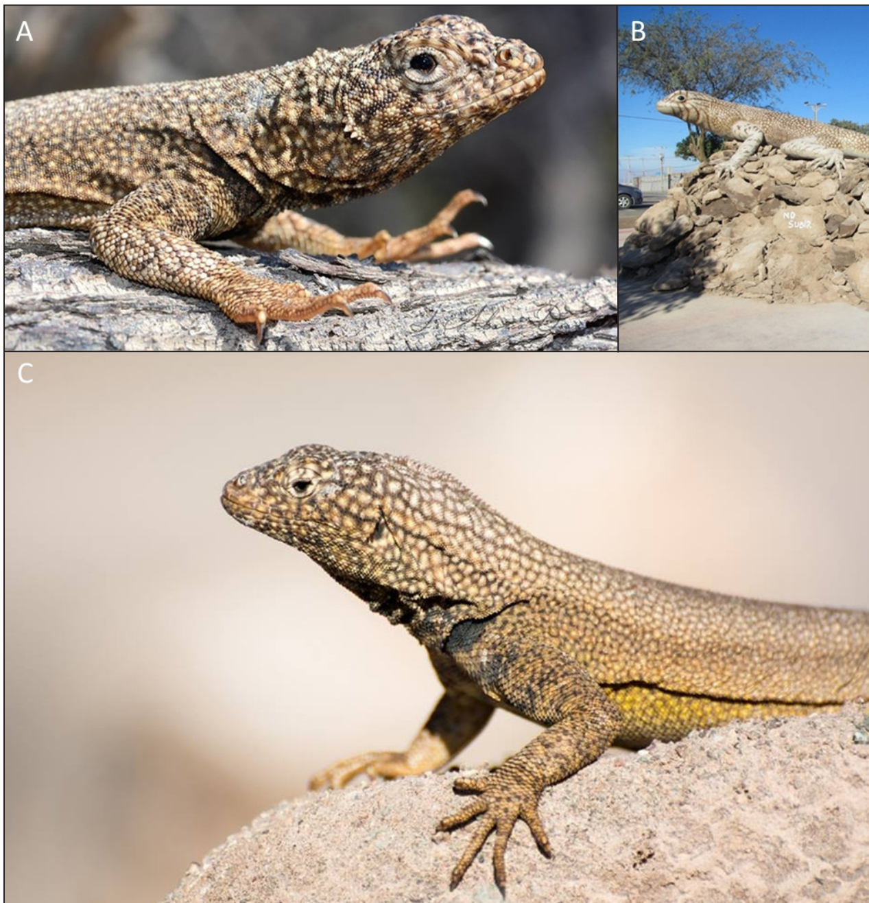
Figura 2. A) Microlophus tarapacensis , Pozo Almonte. B) Escultura de Microlophus en Pozo al Monte. C) M. cf. tarapacensis , Pampa del Tamarugal, 25 km SE de Pozo Almonte.

Microlophus de Chile, ayudara a esclarecer las relaciones entre las especies de este problemático grupo de reptiles chilenos.