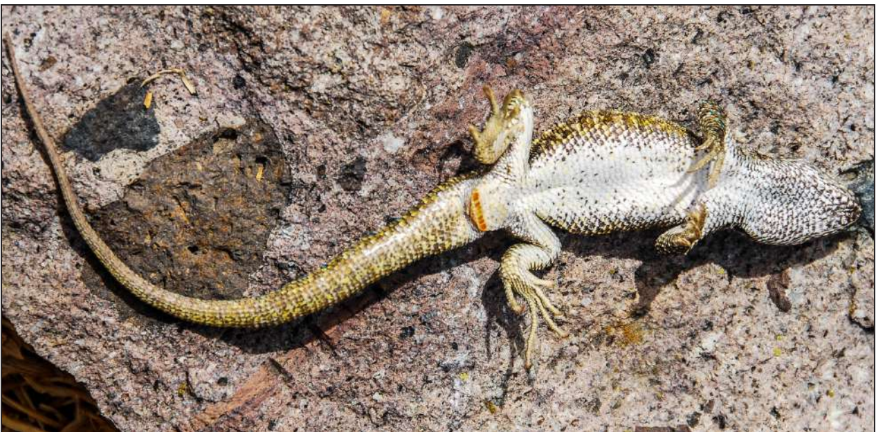
Figura 5. Ejemplar macho en vista ventral de Liolaemus etheridgei de San Antonio de Sogay, Arequipa.

melanogaster , L. ortizi , L. polystictus , L. robustus , L. signifer , L. thomasi , L. williamsi ) y del resto de los Liolaemus . Sin embargo, L. evaristoi sp. nov., tiene similitud fenética y aproximación filogenética con L. etheridgei (Figs. 4–5) con el cual consideramos podrían confundirse (Fig. 6). También se diferencian porque L. evaristoi sp. nov., tiene mayor número de escamas alrededor del cuerpo (54–70, \bar{x} = 64.1 vs. 46–59 \bar{x} = 53.2) y los machos menor cantidad de escamas celestes en el cuerpo, miembros y cola, dichas escamas nunca están presentes en la cabeza como ocurre con L. etheridgei (Tabla 1; Figs. 4–5).