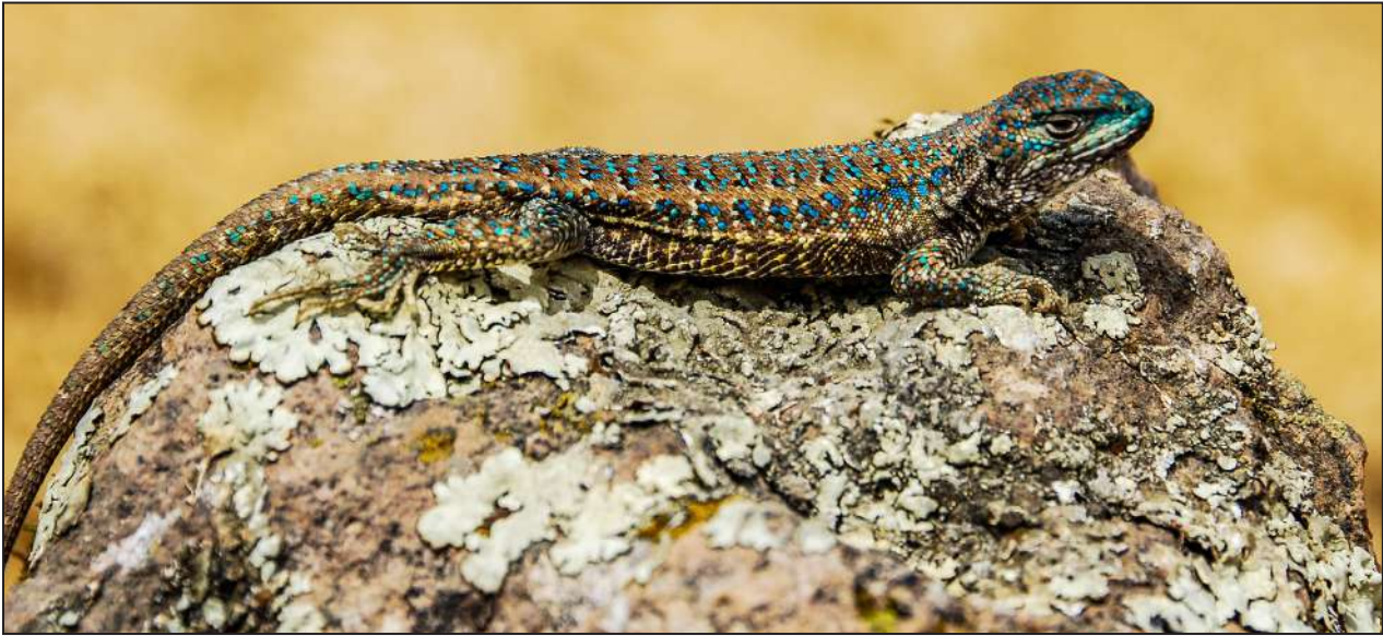
Figura 4. Ejemplar macho en vista dorso lateral de Liolaemus etheridgei de San Antonio de Sogay, Arequipa.