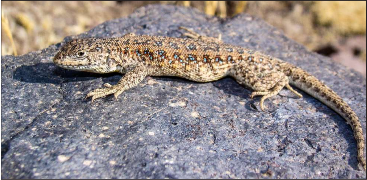
Figura 1. Ejemplar macho en vista dorso lateral de Liolaemus evaristoi sp. nov. de la localidad tipo.