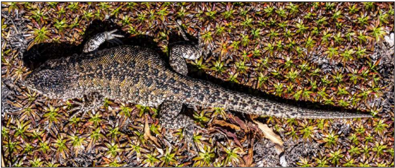
Figura 2. Ejemplar macho en vista dorsal de Liolaemus evaristoi sp. nov. de la localidad tipo. (MUBI 10474 Paratipo).

gráficamente en las cercanías de la localidad de registro de la nueva especie son: Liolaemus etheridgei (Arequipa, Moquegua), L. melanogaster (Ayacucho y Arequipa), L. polystictus (Ayacucho y Huancavelica), L. robustus (Junín y Lima) y L. williamsi (Ayacucho y Arequipa) (Aguilar et al. , 2016). Este grupo, se diferencia de las especies del grupo de L. boulengeri (Abdala, 2007) por tener escamas de igual tamaño en la parte posterior del muslo. Dentro del grupo de L. montanus sensu stricto se distingue de L. audituvelatus , L. famatinae , L. griseus , L. insolitus , L. manueli , L. omorfi , L. poconchilensis , L. reichei , y L. torresi por ser especies de menor tamaño con un máximo largo-hocico cloaca (LHC) menor a 65 mm vs. 70.1