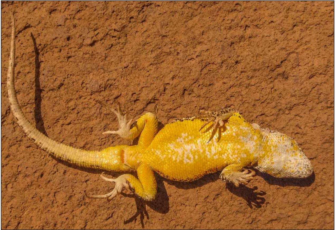
Figura 3. Ejemplar macho en vista ventral de Liolaemus evaristoi sp. nov. de la localidad tipo. MUSA 2842 (paratipo).

este carácter lo diferencia de las especies que tienen escamas yuxtapuestas o subimbricadas sin quilla como L. andinus , L. audituvelatus , L. cazianiae , L. chlorostictus , L. eleodori , L. erguetae , L. fabiani , L. forsteri , L. foxi , L. graciela , L. halonastes , L. insolitus , L. islugensis , L. jamesi , L. molinai , L. manueli , L. nigriceps , L. omorfi , L. patriciaturrae , L. pleopholis , L. poconchilensis , L. poecilochromus , L. porosus , L. reichei , L. robertoi , L. rosenmanni , L. ruibali , L. schmidtii , L. scrocchii , L. tacora , L. torresi , L. vallecurensis y L. vulcanus . Asimismo L. evaristoi sp. nov., se diferencia de las especies que tienen escamas dorsales del cuerpo imbricadas y con quilla evidente como L. aymararum , L. disjunctus , L. etheridgei , L. fittkaui , L. griseus , L. huacahuasicus , L. montanus , L. orko , L. ortizi , L. pulcherrimus , L. signifer , L. thomasi y L. williamsi .