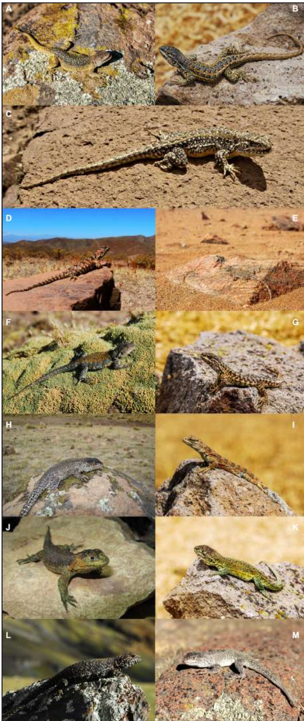
Figura 8. Placa con fotos de ejemplares machos de las diferentes especies que consideramos válidas del grupo de Liolaemus montanus para Perú. A: L. annectens de Sumbay, Arequipa. B: L. etheridgei de San Antonio de Sogay, Arequipa; C: L. evaristoi de Huaytará, Huancavelica; D: L. igneus de Anexo Girata, Tacna. E: L. insolitus de Mejia, Arequipa. F: L. melanogaster de Los Libertadores, Ayacucho. G: L. ortizi de Santa Barbara, Cusco; H: L. polystictus de Santa Inez, Huancavelica; I: L. poconchilensis de Sama, Tacna; J: L. robustus de Huancayo, Junín. K: L. signifer de Huancané, Puno. L: L. thomasi de Mahuayani, Cusco; M: L. williamsi de Pampas Galeras, Ayacucho.