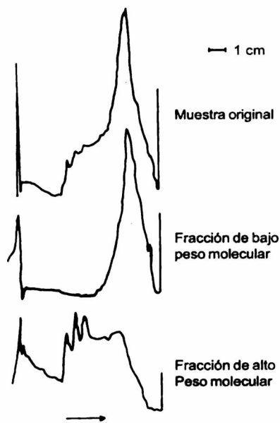
Figura 3. Densitogramas de separaciones isotacofóreticas en geles de poliacrilamida de AH y dos fracciones de AH obtenidas por permeación en geles. La flecha indica el sentido de la migración de los aniones. Modificada de Curvetto y Orioli (1982).

Densitometric traces of the isotachopheretic separation of a humic acid sample and two molecular weight AH fractions obtained from it by gel permeation. The arrow indicates the direction in which the anionic species migrate.