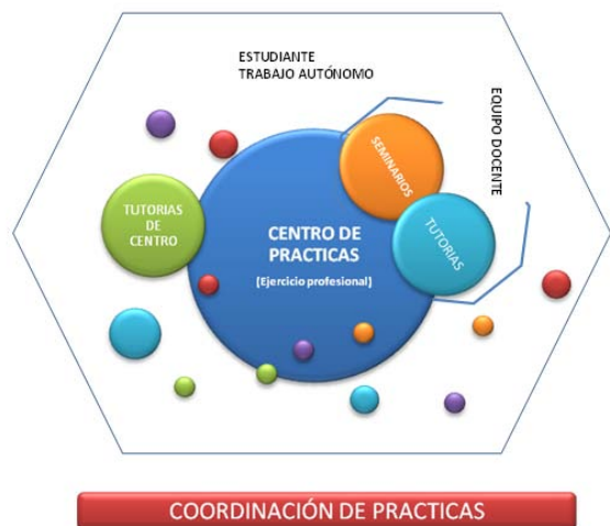
Figura 2. Representació gràfica de l'escenari formatiu de les pràctiques externes

Des d'un model de formació de les pràctiques externes coresponsable no es pot deixar a l'atzar la seva planificació. Les pràctiques no es poden improvisar, requereixen una intencionalitat formativa. Per això és tant important la funció docent del tutor de centre i del tutor de la universitat, com la implicació de l'estudiant.