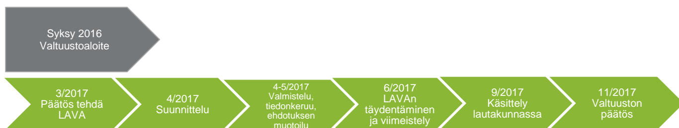
Kuvio 3. Iltapäivätoiminnan maksujen alentaminen Jyväskylässä.

Jyväskylän LAVAssa vaikuttaa vahvasti perusopetuslaki, YK:n lapsen oikeuksien sopimus sekä lasten ja lapsiperheiden yhdenvertaisuus. Tutkimustiedon kautta LAVA peilaa aamu- ja iltapäivätoiminnan merkitystä lapseen kohdistuviin psykososiaalisiin vaikutuksiin. Jyväskylän kaupungin hyvinvointikertomuksen keskeisiä kehittämisen painopistealueita ovat yksinäisyyden vähentäminen, eriarvoisuuden ja polarisaation loiventaminen sekä palvelujen saatavuus ja saavutettavuus. Lapsen osallistumattomuus iltapäivätoimintaan ja yksin kotona oleminen aiheuttivat arvioinnin perusteella huolta sekä vanhemmille että toiminnanjärjestäjille.