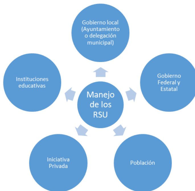
Figura1. Agentes locales del manejo de residuos sólidos urbanos.