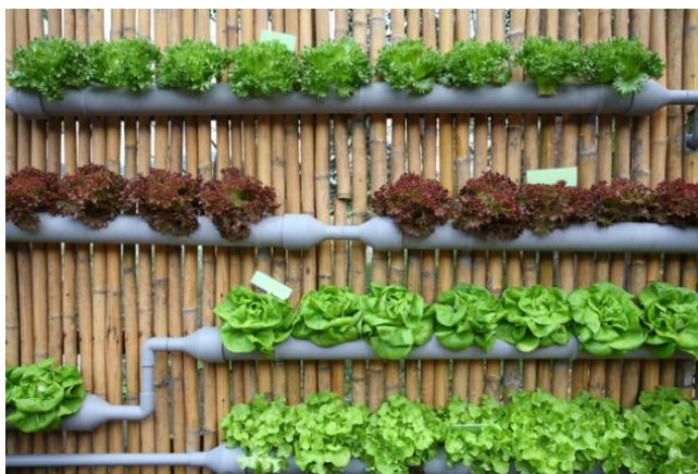
Figura No. 5 Huerto urbano o Agricultura Urbana horizontal.

Configurados los valores como las líneas transversales, incorporamos el carácter globalizador de la relación atribuyendo un “engarzamiento” y un “enhebramiento” de éstos con todo el conjunto de las “acciones efectivas” posibles, construyéndose la conducción del aprendizaje a través de formas de acción social basadas en la racionalidad con arreglo a valores. Este aprendizaje es significativo, incorporando los nuevos conocimientos de forma sustantiva en la estructura cognitiva del que aprende. Recuperado de: www.autoempleosostenible.com/huertos-urbanos-ecologicos-escuela-de-valores