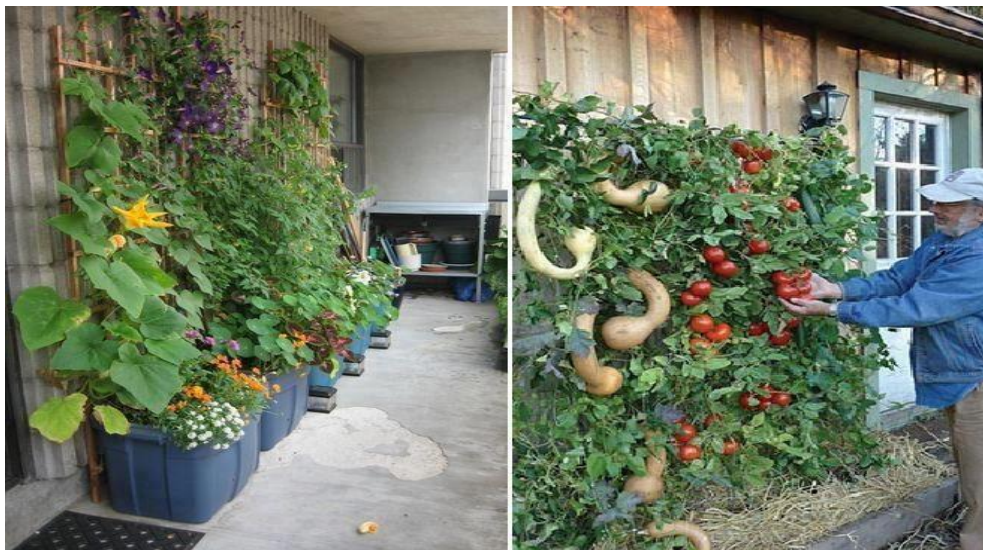
Figura No. 4 Huerto urbano con material reciclado.