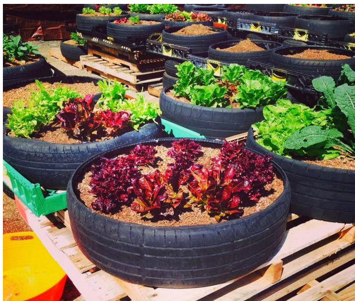
Figura No. 2 Ejemplo de la aplicación de Huertos Urbanos o Agricultura Urbana

efectivas” ligadas al área de valores contenidos en el Respeto por la Biodiversidad , otro de los pilares básicos en que se basa el Desarrollo Sostenible.