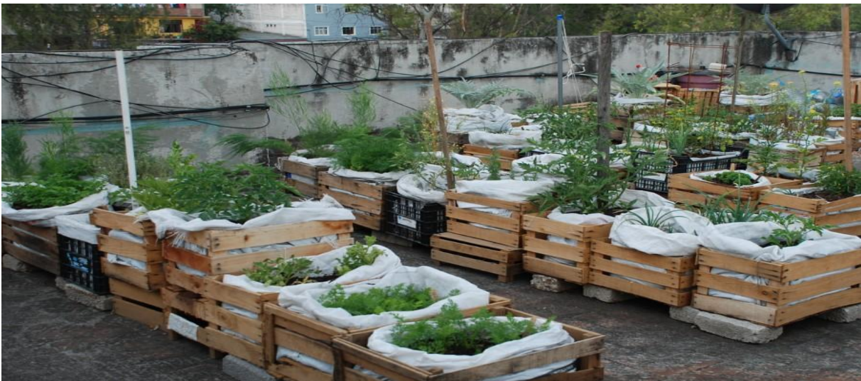
Figura No. 6 Huerto urbano o Agricultura Urbana en azoteas.

Remangarse la camisa, poner las manos en la tierra y comer alimentos que uno mismo ha plantado, ayuda a lograr esa deseada armonía que tanta gente busca. Y que sobre todo el planeta necesita.