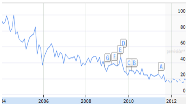
Figura 3: Evolución de las búsquedas del termino "IFLA" desde el año 2004.