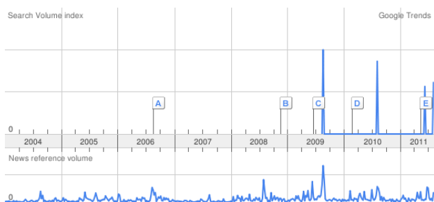
Figura 2: Gráfico de la evolución del termino "IFLA" desde el año 2004.

En la parte superior del gráfico que se muestra aparecen las variables de búsqueda a lo largo del tiempo (eje abscisas) y en el gráfico inferior las noticias publicadas sobre la IFLA. En el eje vertical representa la frecuencia con la que se ha buscado el término globalmente.