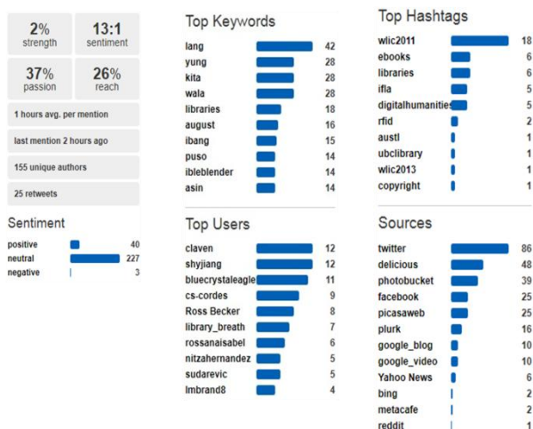
Figura 1: Gráficos de las búsquedas del termino "IFLA" el día 1/09/11.

Se observa que el motor de búsqueda de Socialmention es muy completo, el cual trabaja con más de una centena de redes sociales, entre las cuales se encuentran Twitter, Facebook, LinkedIn, YouTube, StumbleUpon, Digg o Google, permitiendo la exportación a hojas de cálculo de la información obtenida. Como dato positivo cabe destacar la eliminación de búsqueda en los scraper sites.