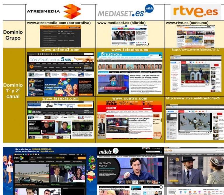
Imagen 4: Localización de marcas en el entorno on-line

(imagen 4), se han localizado otras que cada magrogrupo explota en Internet (Nubeox y El sótano, como ejemplos de la marca on-line Atresplayer; Mitelekids o LVP en Mitele, o Archivo y Filtoteca en RTVE). Se destaca en este punto que RTVE es el único grupo que mantiene la misma marca de explotación de sus canales TDT y on-line , -web y móvil- mientras que Mediaset y Atresmedia apuestan por una segunda marca (Mitele y Atresplayer, respectivamente). Además, se localiza la presencia de los grupos en otras plataformas de VoD como YouTube y, finalmente, se ha observado la oferta de estas comunidades (bajo registro) para determinar su nivel de desarrollo.