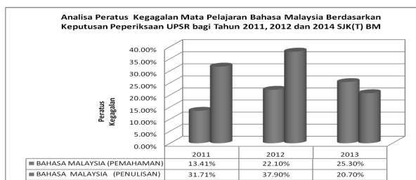
RAJAH 2. Analisa Peratus Kegagalan Mata Pelajaran Bahasa Malaysia Berdasarkan Keputusan Peperiksaan UPSR Bagi Tahun 2011, 2012 dan 2013 SJK (T) BM.

BM PEN pula menunjukkan penurunan dari tahun 2011 sehingga 2012 dan seterusnya berlaku peningkatan dari tahun 2012 sehingga 2013. Hal ini adalah berbeza jika dibandingkan dengan peratus kelulusan BM PEM. Peratus kelulusan pada tahun 2011 adalah sebanyak 68.29% dan menurun kepada 62.10% pada tahun 2012. Manakala, pada tahun 2013 pula peratusan kelulusan telah meningkat kepada 79.30%. Daripada data tersebut, peratusan kelulusan telah menurun sebanyak 6.19% dari tahun 2011 sehingga 2012 dan menunjukkan peningkatan sebanyak 17.2% dari tahun 2012 sehingga tahun 2013. Pemerhatian pengkaji mendapati bahawa sikap, motivasi dan kesediaan murid berhubung kait antara satu sama lain. Hal ini turut diperkukuhkan dengan pendapat Gardner & Lambert, 1972 dalam Zamri Mahamod, 2004. Menurut mereka, murid yang bersikap positif, bersedia untuk belajar dan bermotivasi tinggi akan memperlihatkan kejayaan dalam menguasai bahasa sasaran dan sebaliknya.