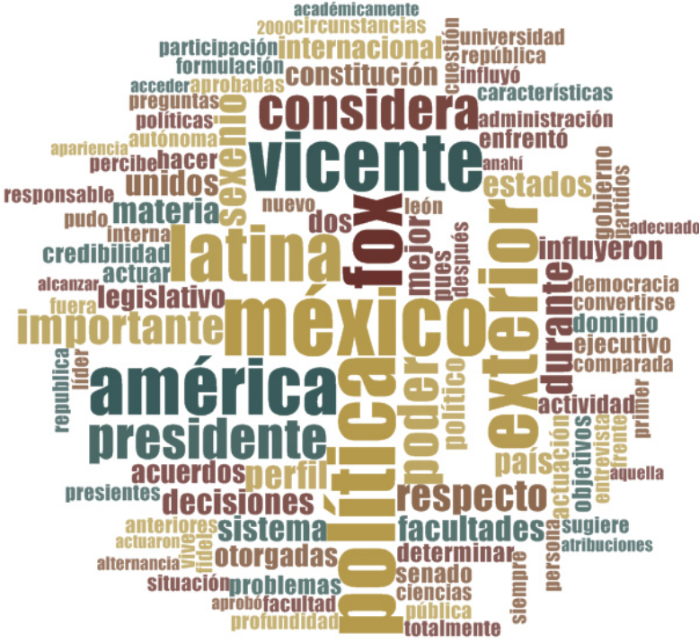
Ilustración 2 Nube de GD, Participación Política de México en América Latina

Pero nos encontramos con situaciones que se presentan en el transcurso de su mandato, que menciona el grupo como las circunstancias, la credibilidad por parte de los mandatarios de los demás países de América Latina y recordamos la situación que se presentó con el candidato a la presidencia de la OEA.