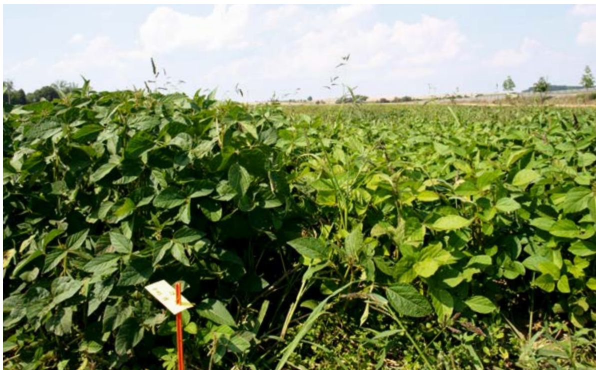
A sinistra la semente di soia è stata inoculata con bradyrhizobium, quella a destra no.