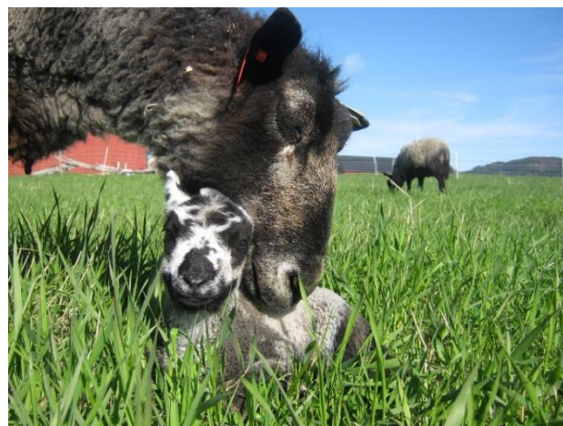
Bilde 2: Sau og lam som har dannet et sterkt bånd.

Sauen har god evne til å kjenne igjen individer. Forskning har vist at sauer kan gjenkjenne følelser i ansiktsuttrykk, ikke bare hos andre sauer, men også hos mennesker. De foretrekker et smilende og avslappet ansikt fremfor ansikter som viser sinne eller stress. Forskning har vist at sauer kan huske minst 50 forskjellige saueansikter i to år.