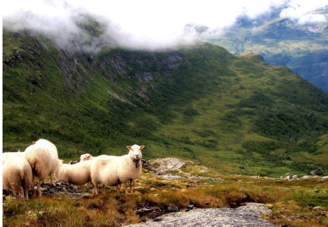
Bilde 5: Sauer på utmarksbeite.

Omtrent 2 millioner sauer og lam går på utmarksbeite hver sommer i Norge. Disse står for 3/4 av høstingen som gjøres i norsk utmark. Sauen er kanskje det husdyret som passer best til å beite i utmarka. Omtrent halvparten av beiteressursene i utmarka utnyttes i dag, antall beitedyr er for lavt de fleste steder i landet, noe som gjør at den norske utmarka gror igjen. Dette fører igjen til at beitekvaliteten langsomt blir redusert på store areal.