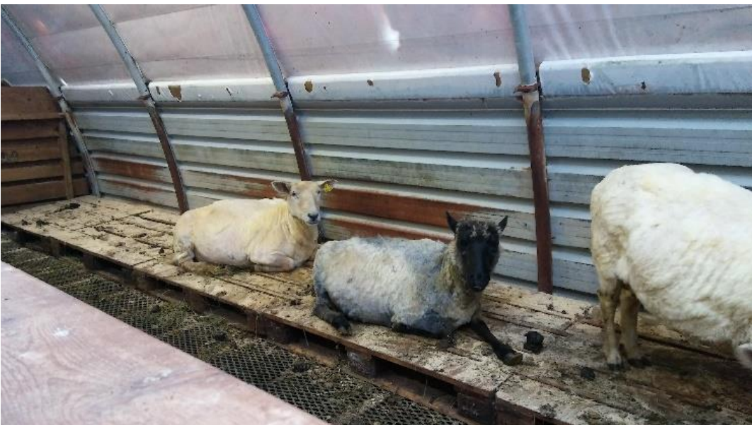
Bilde 7 og 8: Sauer som har valgt å legge seg på liggepaller både med lang og kort ull.