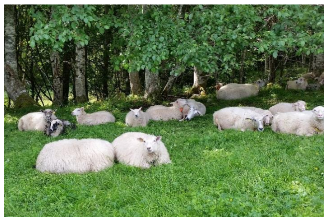
Bilde 1: Sauer som hviler sammen på innmarksbeite.

den blir skilt fra flokken. Den sterke flokkatferden kan man bruke for å lette arbeidet med flytting og sanking av sau, og man bør ta hensyn til den for å redusere stress hos dyra.