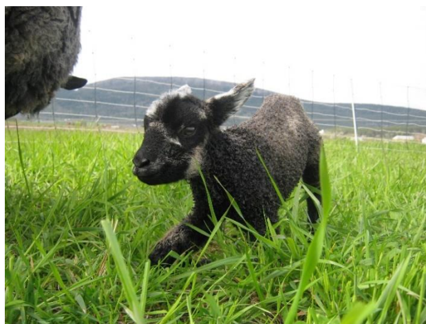
Bilde 3: Et nyfødt lam som skal reise seg for første gang.