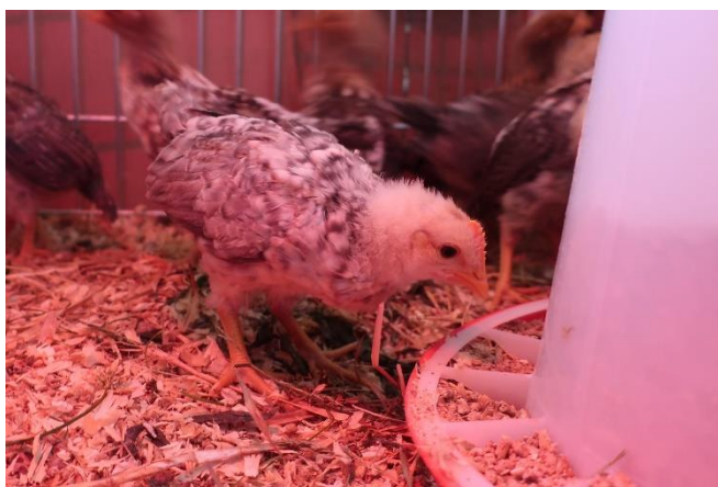
Bilde 3: Jærhøns-kylling på 3 uker som spiser kraftfôr.

Jærhøns er Norges eneste nasjonale hønserase. Den er etterkommer etter den opprinnelige, norske landhøna og er i dag en bevaringsverdig men truet rase. Landhøna var nesten utryddet da arbeidet med å ta vare på og foredle den begynte på Jæren i 1916. Rasen fikk da navnet jærhøns og det ble satt strenge krav til standardfarge. I dag kan rasen spores tilbake til ett familiepar og er derfor sterkt innavlet. Jærhøns er kjent for meget lav kroppsvekt, store egg i forhold til kroppsvekta, og god skallkvalitet. Den er hardfør, aktiv, flink til å finne mat, kan være litt sky, og den er flink til å fly.