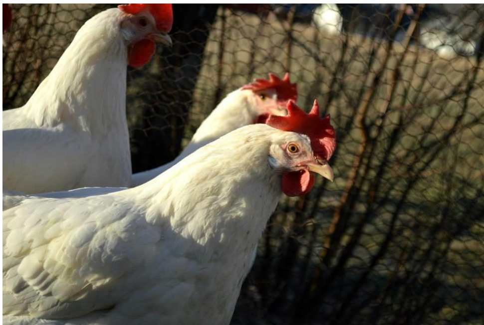
Bilde 7: Økologisk høns på uteområde.