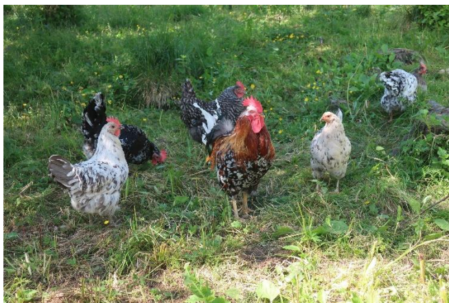
Bilde 5: I økologisk produksjon skal fjørfe ha tilgang til uteområde.

I tillegg til større areal inne skal økologiske fjørfe ha tilgang til en utendørs luftegård når værforholdene tillater det, og minst i en tredjedel av livet. Luftegårdene skal være dekket hovedsakelig med vegetasjon, gi rimelig ly og lett tilgang til vann. Forholdene skal tilrettelegges med overbygget utgang/ly slik at fjørfeet vil gå ut og benytte luftegården, for eksempel ved å henge et nett (kamuflasjennett) over deler av ut-/inngangen. Luftegården skal ha minst 4 m 2 per verpehøne eller slaktekylling.