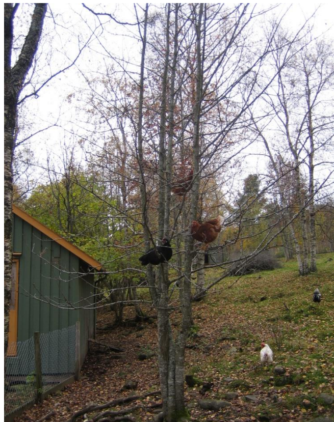
Bilde 6: Høner som har satt seg oppe i grenene på et tre en høstdag.

Noe annet som kan være lurt for å få høns ut på verandaen og videre ut på uteområdet kan være å ha fôringer på ettermiddag/kveld, fordi det gjerne er på morgenen de har mest lyst til å gå ut.