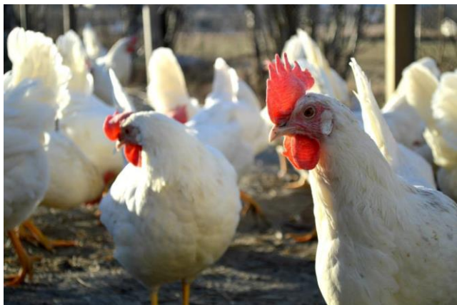
Bilde 1: Den fremste høna følger nøye med både med syn og hørsel.

en smaksans med 350-500 smaksløker på innsiden av nebbet. Vi mennesker har ca. 10 000 smaksløker. Høns kommuniserer hovedsakelig gjennom kroppsspråk, og bruker minst 24 ulike lyder. De vanligste formene for lydkommunikasjon er matkall, varsel om fare, signal før egglegging og etter egglegging. Når hanen galer markerer han revir.