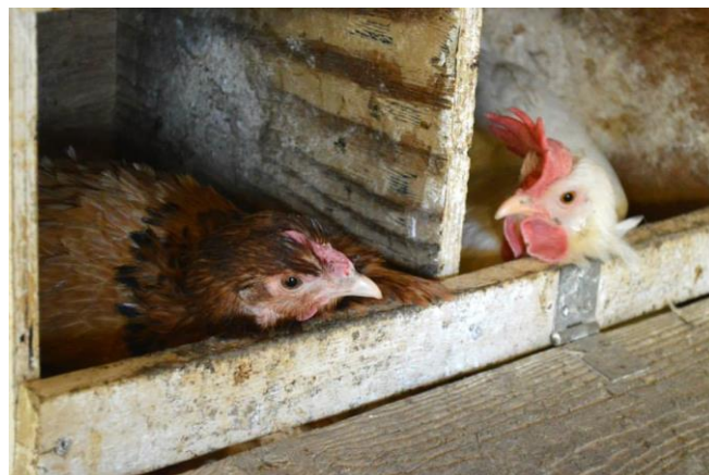
Bilde 2: To høner som ligger i redekasser hvor de legger egg sine.

En-to ganger i året verper ei vill høne 10-15 egg og ruger på disse eggene i 21 dager. Ei tam verpehøne begynner å legge egg ved 18-20 ukers alder og kan legge over 320 egg i året, uten at de er befruktet. Verpehøns i kommersiell produksjon legger egg til de avlives ved 72-80 ukers alder før myting. Myting vil si at voksne høns skifter fjær (myter), dette skjer vanligvis om høsten og hønene har da som regel en pause i egglegginga. Under naturlige forhold vil en hane kunne befrukte 15-20 høner. I kommersiell eggproduksjon er det sjeldent haner tilstede med hønene, slik at egg som kjøpes i butikken normalt ikke er befruktet. Men haner har en beroligende effekt på høner, slik at det kan være fint å ha noen få haner i en stor flokk med høner.