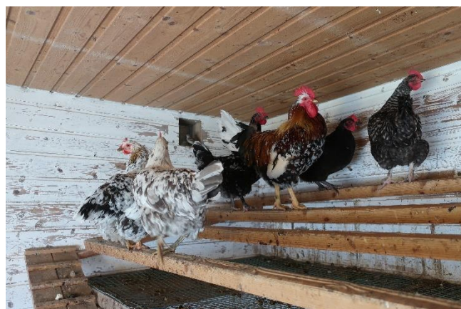
Bilde 4: Hobbyhøns som står på vagler.

Konvensjonelle slaktekyllinger holdes innendørs i store haller, med kunstig lys og med flis som strø på golvet.