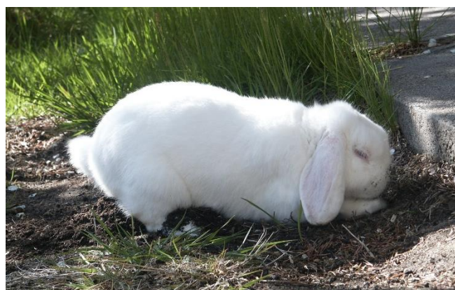
Bilde 1: Graving er en viktig del av kaninens naturlige atferd.

Kaniner trenger å være mye i bevegelse. De har sterke bakben som er ca. dobbelt så lange som forbenene, en lynrask reaksjonsevne, og kan løpe opptil 45 km/t. En kanin vil hoppe og vri seg i luften når den har det bra og er glad.