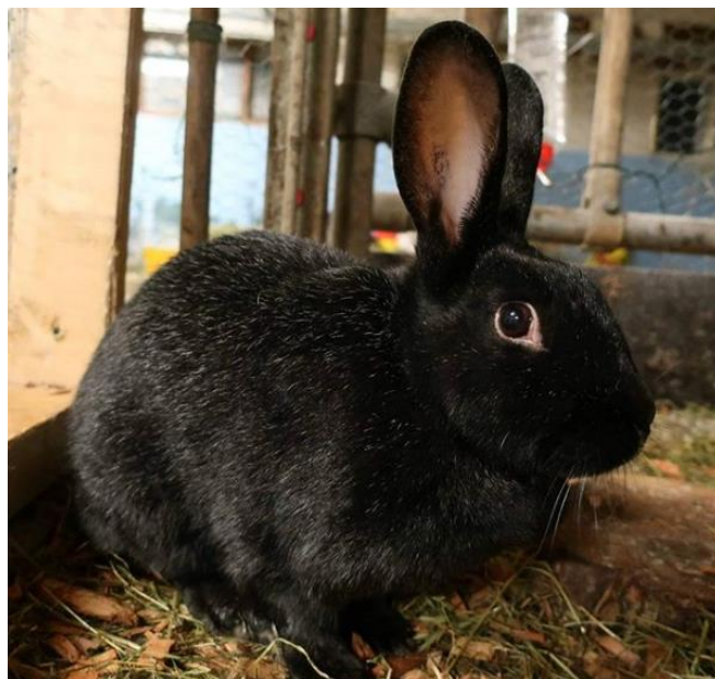
Bilde 9: Trønderkanin.

Trønderkanin er en stor korthåret rase med stående ører og glinsende svart pels med hvite hår inni mellom. Idealvekten er på 4 kg. Trønderkaninen er Norges nasjonalrase, og ble avlet fram i 1916-1918 som en kombinasjonsrase for produksjon av kjøtt og pels. Det var en vanlig kanin i Norge frem til 1970-tallet. I dag holdes den mest som hobbydyr, og har blitt så sjelden at den regnes som sterkt utrydningstruet. På grunn av pelsen har den fått tilnavnet «norsk sølvrevkanin». Det sies at den gjerne kan være sta og hissig, men at den kan bli svært kjælen.