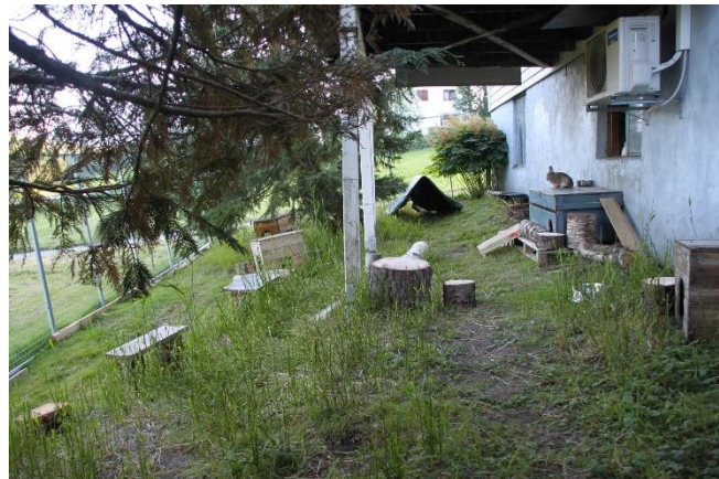
Bilde 7: Et miljøberiket, stort uteområde til kaniner.

Siden villkaniner som lever i underjordiske tunneller ikke utsettes for brå temperaturendringer, bør heller ikke tamkaniner utsettes for det. Man bør ikke plutselig flytte en innekanin ut på vinteren. Man kan flytte en utekanin inn på vinteren, men da er det lurt å først ha den på et kjøligere rom i huset, og kaniner som har vært inne om vinteren bør ikke tas ut igjen før det er passelig temperatur om våren/sommeren.