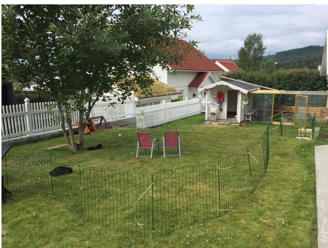
Bilde 5: Mange bruker lekestuer som hus til kaniner som holdes utendørs. Her er det bygd en permanent luftegård ved lekestua som kaninene alltid har fri tilgang til, og ved tilsyn kan kaninene i tillegg springe på et stort uteområde med kompostgjerder rundt.

Kort sagt bør utekaniner alltid ha tilgang til: isolert, svakt temperert og tørt hus, en sikker løpeplass (jo større, jo bedre), pluss at alle kaniner skal ha tilgang til friskt høy og vann som ikke er frosset.