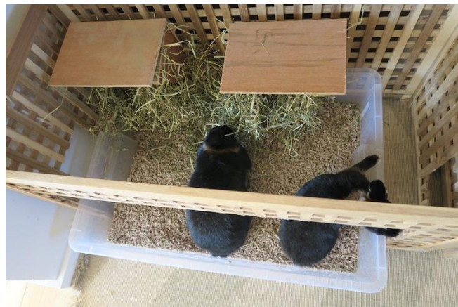
Bilde 4: Når kaninene er kastrerte og bor innendørs kan de enkelt lære seg og bruke en dokasse til å gjøre fra seg når man henger en høyhekk over dokassa. Her er det satt inni bordet «hol» fra Ikea.

skjule ledninger og sette vekk planter der kaninene er. Kaniner er renslige, og det er enkelt å få dem til å bruke en dokasse. Dette kan man gjøre ved å kastrere dem og tilby høy de kan spise ved toalettet.