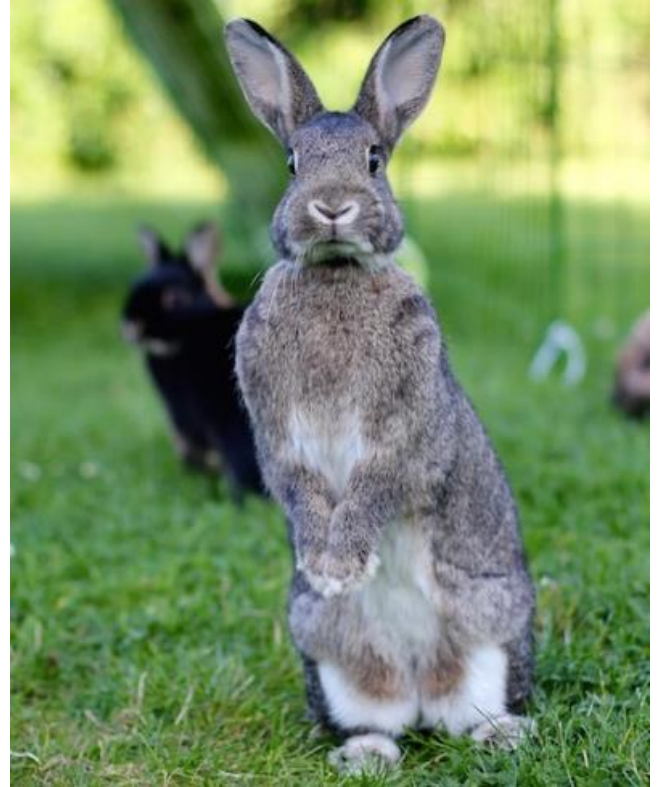
Bilde 10: Dette er en sunn og frisk kanin. Den har fine stående ører, lang snute, normal pels og lang kropp. Ganske lik den europeiske villkaninen.

Kjempekaniner er mer utsatt for å få labbesår, gikt, stive ledd og hjerteproblemer sammenlignet med kaniner av mer naturlig størrelse.