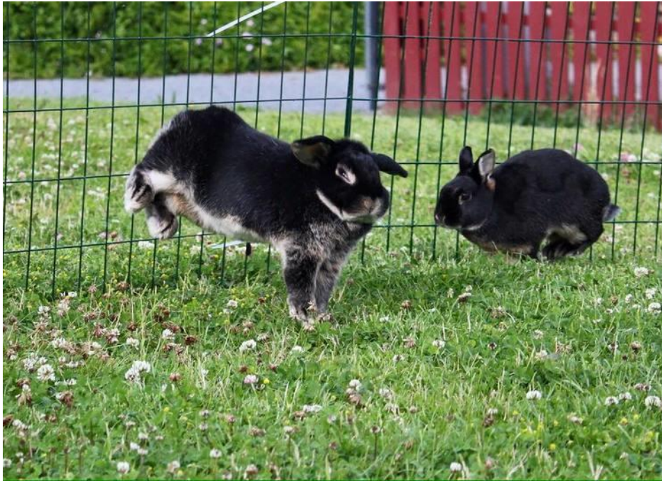
Bilde 10: Kaniner trenger stor plass for å kunne leke, løpe og hoppe.

- For mer info om kanin anbefales «Den store kaninboka» (2010) av Marit Emilie Buseth.