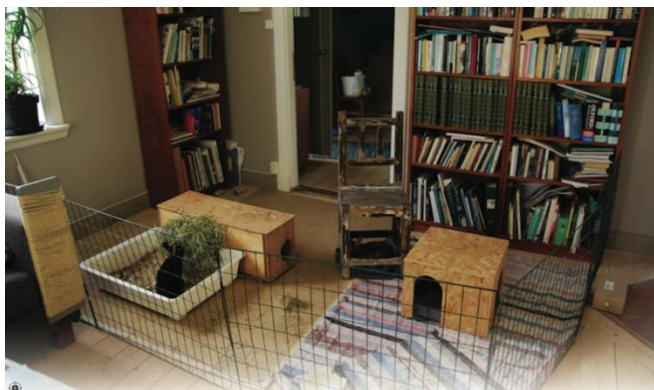
Bilde 3: Kanin som holdes innendørs, her på et begrenset område ved hjelp av kompostgjerdet.

Det er viktig at kaniner har god plass. Kaniner i små bur utvikler raskt benskjørhet og forkalkningsgikt. Allerede etter 6 måneder i små bur kan de utvikle benskjørhet. Porøse knokler og redusert bevegelse i muskler og ledd gir kaninen smerter, og gjør den mer utsatt for brudd og skader. Vedvarende kulde, trekk og fuktighet forsterker lidelsen med dårligere bentetthet. Kaniner som får mulighet til å løpe og bevege seg på et større område har sterkere kropp og tettere benmasse. Kaniner med en stiv kropp kan ha vanskeligheter med å velte seg over på siden som kaniner ofte vil gjøre når de føler velbehag, samt vanskeligheter med å hoppe og løpe normalt, stille seg selv på ryggen eller spise sin egen lort. Det er flere måter å holde kanin på. De kan bo inne, inne om vinteren og ute om sommeren, eller ute hele året. Alle kaniner, både de som holdes inne og de som holdes ute, men kanskje spesielt de som holdes ute, bør ha selskap av minst en annen kanin, da dette har vist seg å ha størst innvirkning på velferd av alle typer miljøberikelser for kaniner.