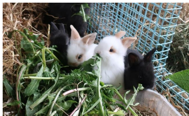
Bilde 2: Kaniner elsker løvetann.

For en kanin bør 85-90 % av kostholdet bestå av høy og gress. Kaninens tenner vokser hele tiden, men slipes ned når den spiser høy, grener og kvister. Kaninen er tilpasset for å spise mye næringsfattig og fiberrik mat som går raskt gjennom systemet, og høy er nødvendig for å holde i gang en ømfintlig fordøyelse. Man kan også gi litt mager og fiberrik pellets, rundt 1-2 ss per kg kanin per dag. Mengden tilpasses individ etter hold og behov, og pelletsen sikrer at kaninen får i seg nok vitaminer og mineraler. Det bør være en gressbasert pellets som er beregnet for kanin. Kaninene kan også gjerne få en daglig porsjon med grønn bladsalat.