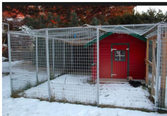
Bilde 6: Her har en hundegård blitt til en kanningård.