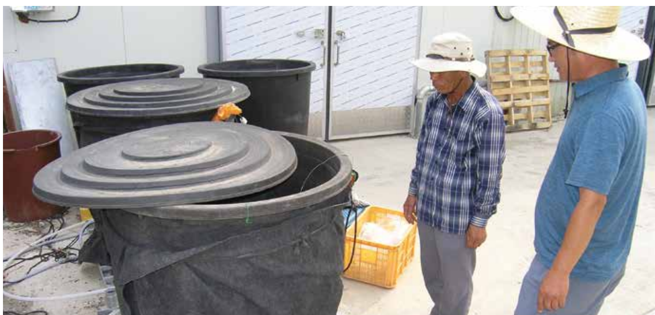
Do-it-yourself: fermentazione di concimi su base di microrganismi. Sono prodotti in proprio anche sostanze come zolfo calcico o poltiglia bordolese.