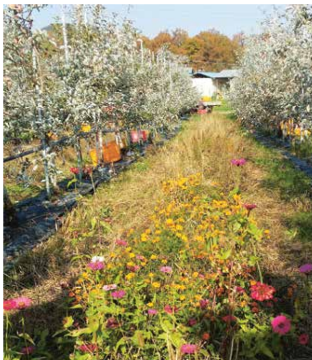
Le strisce fiorite del progetto FiBL in Corea del Sud attirano insetti utili.

Nella Corea del Sud la frutta è sempre più apprezzata ma viene sovente considerata un bene di lusso. Una dozzina di mele di qualità ineccepibile possono essere vendute senza problemi al prezzo di 90 franchi. Imballate in confezioni accattivanti e sfarzose rappresentano un gradito regalo. La società sudcoreana reputa molto importante la qualità e la sicurezza degli alimenti. Negli anni novanta la popolazione è stata scossa dai danni ambientali causati dall'eccessiva concimazione e dall'inquinamento da pesticidi. Questi scandali hanno però contribuito a far lievitare le vendite dei pionieri dell'agricoltura biologica sudcoreani e alla creazione di programmi di finanziamento nazionali. La produzione bio ha ora raggiunto un elevato livello, il sistema di certificazione è controllato dallo Stato ed è riconosciuto da Svizzera, UE e USA. A promuovere lo smercio nel Paese contribuisce il fatto che in numerose scuole sono le autorità locali a finanziare il pranzo preparato con prodotti ecologici. E anche le organizzazioni di produttori e consumatori fondate per solidarietà con la popolazione contadina assicurano le vendite, la vita rurale infatti è considerata sinonimo di povertà. Questo luogo comune alimenta l'esodo dalle campagne con la conseguenza che la popolazione rurale invecchia e non si trovano successori per le aziende agricole.