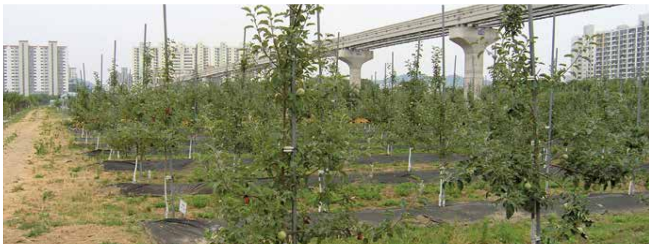
L'attenzione alla qualità è elevata e il reddito disponibile aumenta: buoni presupposti per la frutticoltura bio in Corea del Sud.