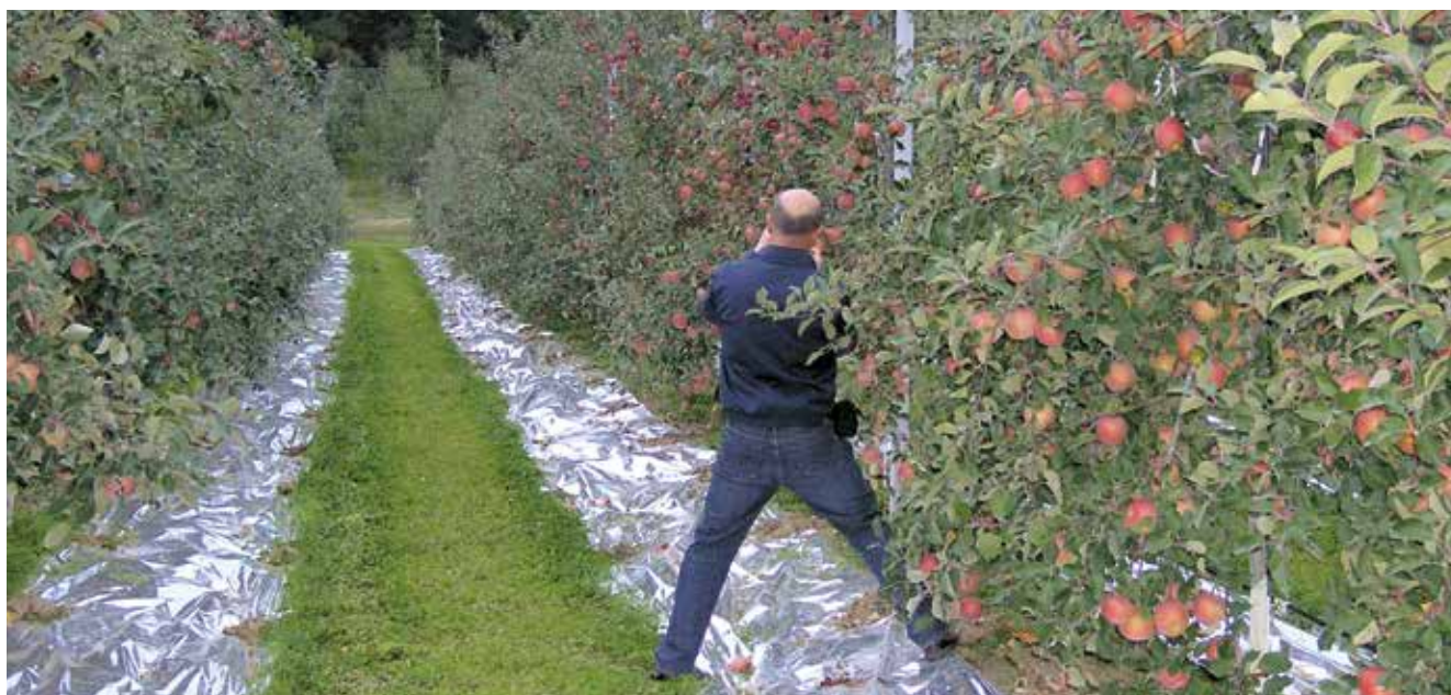
Sono richiesti frutti grandi, rossi e dolci: i fogli di carta alu riflettente favoriscono la colorazione completa soprattutto delle varietà tardive.