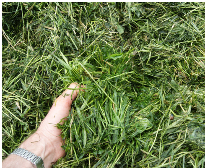
Transporten af græsset er en stor omkostning i forbindelse med bioraffineringen.

for at forbedre økonomien i den grønne værdikæde, i takt med at bioraffineringsteknologien modnes, og drift og lokalisering af anlæg og biomasse optimeres.