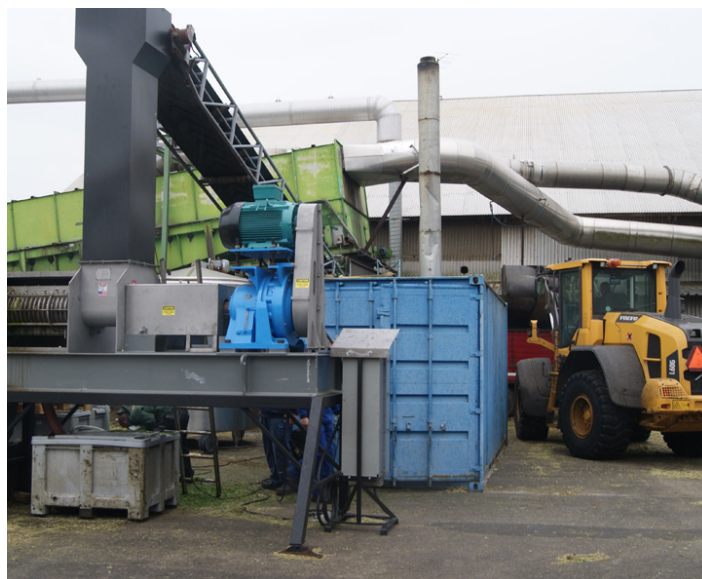
De praktiske forsøg med bioraffineringen af græs finder sted på anlægget i Foulum.

Da man i sin tid startede Organo-Finery projektet, så man bioraffinaderiet som en mulighed for dels at producere dansk økologisk protein af "sojakvalitet", dels at give de økologiske planteavlere muligheden for et forbedret sædskifte med kløvergræs og dermed en ny salgsafgrøde. Men som det fremgår ovenfor skal der samles ca. 2.000 hektar