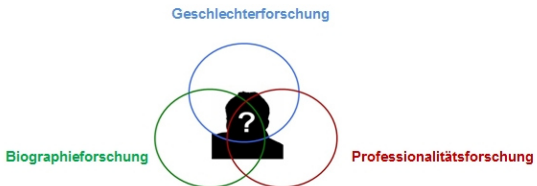
Abb. 1: Forschungsdimensionen (eigene Darstellung)

Teil A , bietet einen theoretischen Zugang zum Forschungskontext mit drei Dimensionen an: Die Geschlechter- und Professionalitätsforschung sowie der Biographieforschung . Dies berücksichtigt die Komplexität des Forschungsgegenstandes, der männlichen Geschlechtsidentität aus der Perspektive beruflicher und biographischer Selbstbeschreibungen von Jungenarbeitern. Die Grafik veranschaulicht die Reziprozität der einzelnen Forschungsdimensionen, deren chronologische Behandlung je nach Kontext der Forschungsarbeit variiert. Je nach Gegenstand der Betrachtung bildet eine Dimension den Ausgangspunkt, um den sich die beiden anderen gruppieren. 9