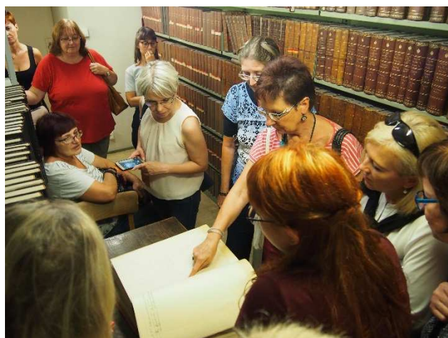
Obrázek 4 Knižní katalogy

Vyhledávání dokumentů uživatelům komplikuje fakt, že knihovna používá 3 různé katalogy – knižní katalogy, lístkové a od 90. let elektronický, při čemž při přechodu na nový typ nedošlo ke zpětné katalogizaci již vlastněných dokumentů. Proto je jedna z jejich studoven vybavena slovníky všech druhů, encyklopediemi, bibliografiemi – vším, co by uživatel mohl potřebovat při