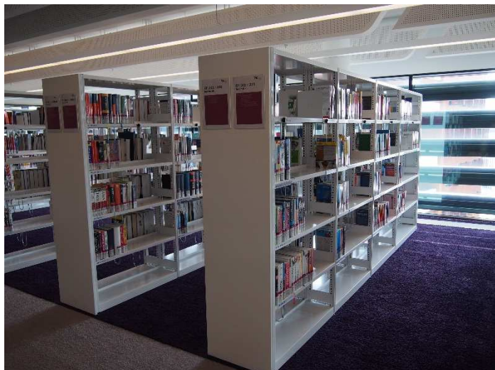
Obrázek 9 Volný výběr

Knihovna má v areálu kampusu čtyři pobočky. Knihovní centrum OMV obsahuje základ knihovního fondu. Nachází se zde také sbírka učebnic WU. Dále je zde literatura týkající se