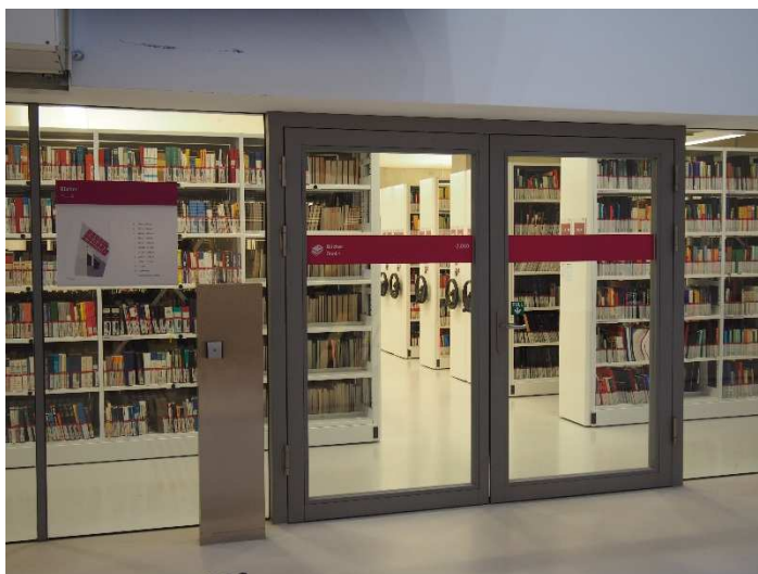
Obrázek 10 Suterén

V suterénu se nachází dokumenty úrovně 2 – tyto dokumenty si mohou vypůjčit všichni uživatelé na dva týdny s maximálním prodloužením do 6 měsíců, maximální počet výpůjček je 15. Na tyto dokumenty je možné udělat rezervaci. Dokumenty jsou řazeny číselně. Nachází se zde také odborné práce a svázaná čísla starších časopisů. Tyto dokumenty jsou v režimu prezenčního půjčování, proto jsou zde umístěny skenery, které je možné používat bezplatně.