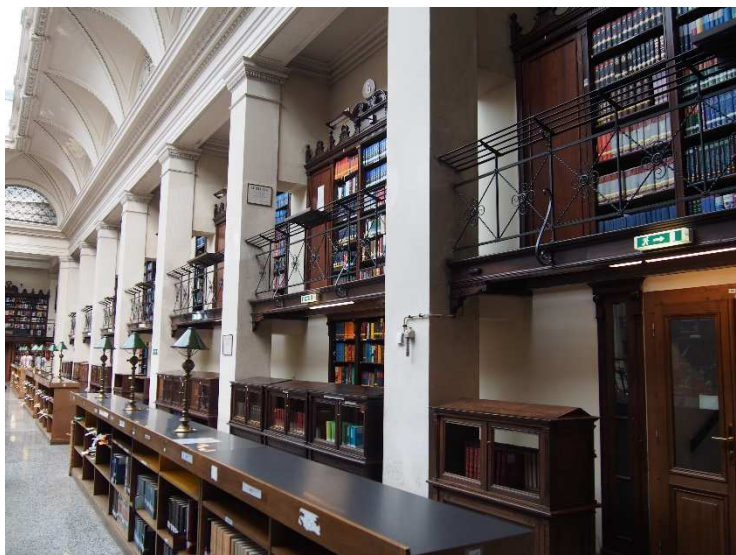
Obrázek 2 Jedna ze studoven

Fond knihovny čítá na 7,4 miliónu svazků a asi půl miliónu elektronických knih, které slouží 120 000 čtenářů.