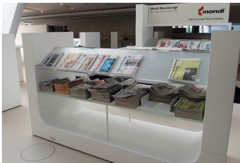
Obrázek 11 Časopisy

Ve čtvrtém patře se nachází klubovna a aktuální čísla časopisů a novin, zde umístěné počítače umožňují vstup do databáze se 4 tisíci on-line tituly časopisů a novin.