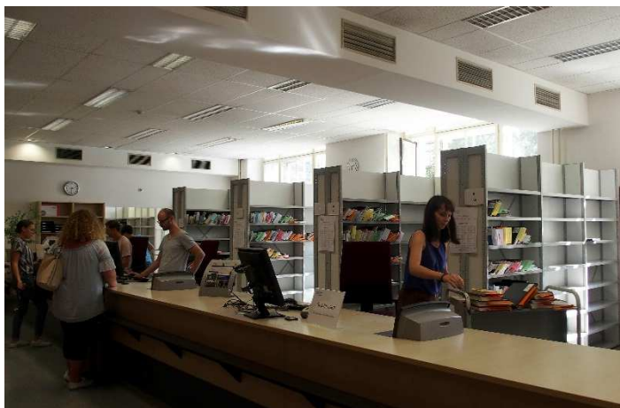
Obrázek 1 Knihovna Vídeňské univerzity

Knihovna se nachází v samém centru Vídně. V 19. století byl záměr vybudovat v centru okruh, kde bude vedle sebe stát co nejvíce kulturních a vzdělávacích institucí. Po poměrně složité historii k nim měla patřit i knihovna Vídeňské univerzity. Bohužel na pozemku původně určeném knihovně nakonec císařská rodina vystavěla kostel jako