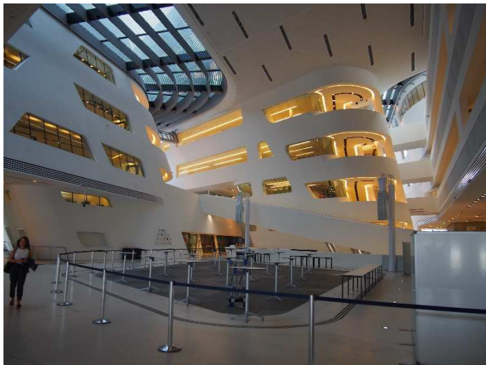
Obrázek 7 Interiér knihovny

Knihovna se nachází v budově Library & Learning Center, která byla navržena studiem architektky Zahy Hadid a stavěla se v letech 2008-2013. Vnější vzhled budovy utváří tmavá a světlá část stavby. Fasádní prvky jsou vyrobeny z betonových vláken a jsou barveny. Obě stavební části jsou odděleny skleněným spojem. Výrazným architektonickým prvkem je přečnávající střecha.