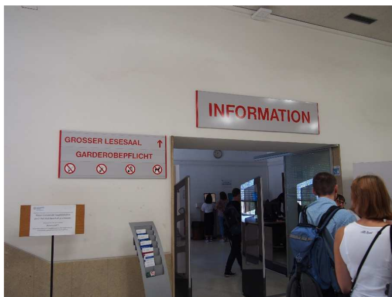
Obrázek 5 Informace

Podle slov naší průvodkyně německé knihovny používají převážně selekční jazyk, vytvořený Pruskem speciálně pro německy mluvící země, ale katalogizátoři na Vídeňské univerzitě dnes přidávají do svých záznamů věcný popis podle jakéhokoliv selekčního jazyku, který dohledají.