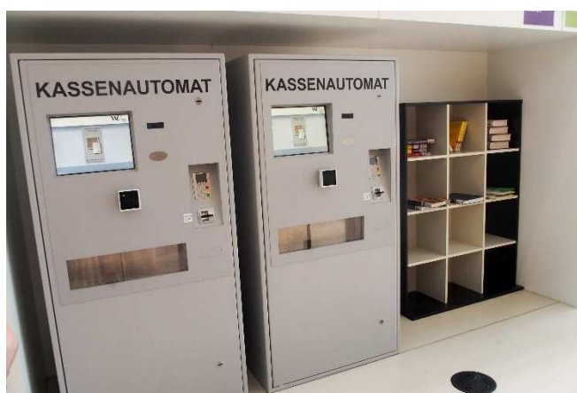
Obrázek 13 Automaty na placení poplatků

Uživatelé si do knihovny mohou vzít vše, co potřebují ke studiu, ale pouze v průhledných taškách. Nápoje pouze