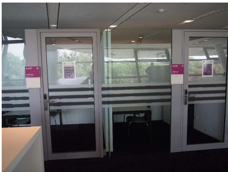
Obrázek 12 Rezervovatelné studovny

Knihovna má také nepřístupné podlaží se skladem dokumentů, které si uživatelé objednávali v katalogu a musí si je vyzvednout do tří dnů od obdržení potvrzovacího e-mailu.