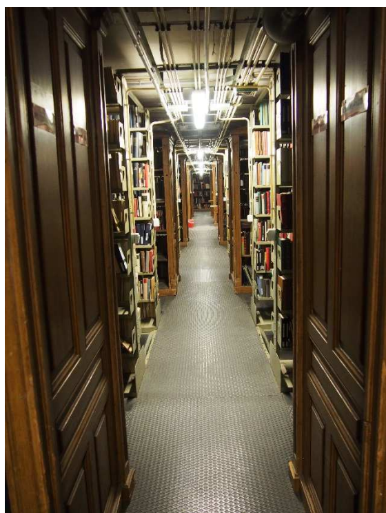
Obrázek 3 Jedna z mnohých chodeb ve skladu

elektrické zásuvky. Sklady pak jsou průřezem historií knihovny, protože v nich vedle sebe stojí regály zakoupené od počátku i v průběhu života knihovny. Jsou hotovým bludištěm napříč celou budovou, kde jsou knihy umístovány podle své velikosti.