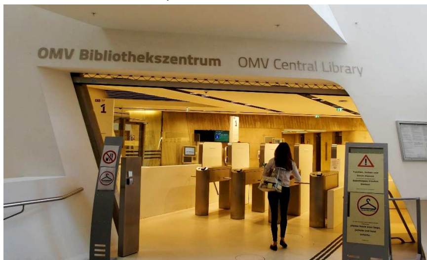
Obrázek 8 Vstup do knihovny

Návštěvníci vstupují do prostorného atria, kde se nachází centrální recepční pult a první kontaktní místo univerzity. Provozní doba tohoto informačního místa je od pondělí do pátku