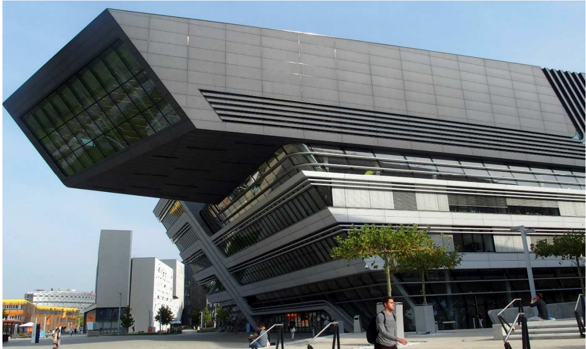
Obrázek 6 Budova knihovny

Kterou jsme navštívili druhý den, se nachází v kampusu Wirtschaftsuniversität Wien.