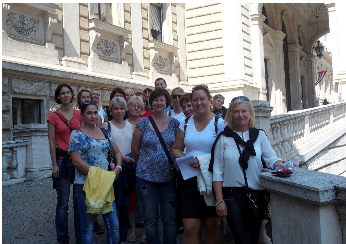
Obrázek 14 Společné foto

Knihovna Wirtschaftsuniversität už nám byla trochu bližší svým tematickým zaměřením fondu, ale také třeba polohou knihovny ve velkém areálu univerzitního kampusu (zatímco Vídeňská univerzita je více rozdrobena po Vídni). Protože však byla postavena jako