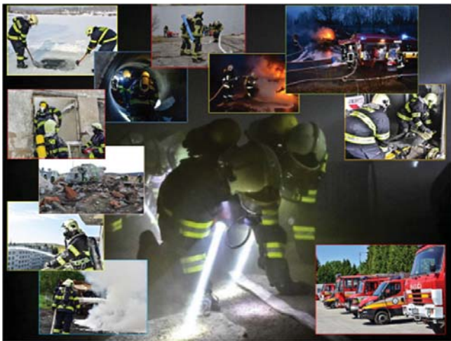
Obr. 3 VC HaZZ Lešť dôkladne preverí akcieschopnosť hasičskej jednotky (Lešť, 2018)

Zo základných požiadaviek na akcieschopnosť a úlohu vyplývajú aj požiadavky na výcvik. Od základnej prípravy má výcvik základnú postupnosť od jednotlivca, hasičské družstvo až celú hasičskú jednotku.