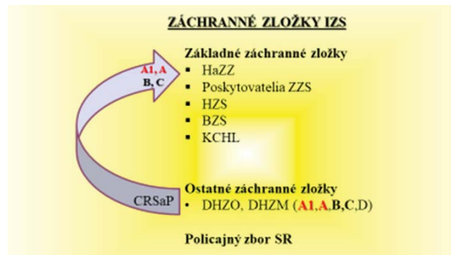
Obr. 4 Posun DHZO v hierarchii záchranných zložiek IZS

celoplošného rozmiestnenia síl a prostriedkov v rámci garantovanej pomoci občanovi poskytovanej zásahom hasičských jednotiek, posúva tieto jednotky do úplne inej roviny. Vytvorenie systému s využitím DHZO vo forme jednotiek prvého nasadenia (A1, A), ale aj podporných jednotiek HaZZ (B, C), vrátane dobrovoľných hasičských zborov špeciál (Vyhláška 611, 2006), evokuje možnú zmenu rozdelenia záchranných zložiek IZS, s dôrazom na hasičské jednotky.