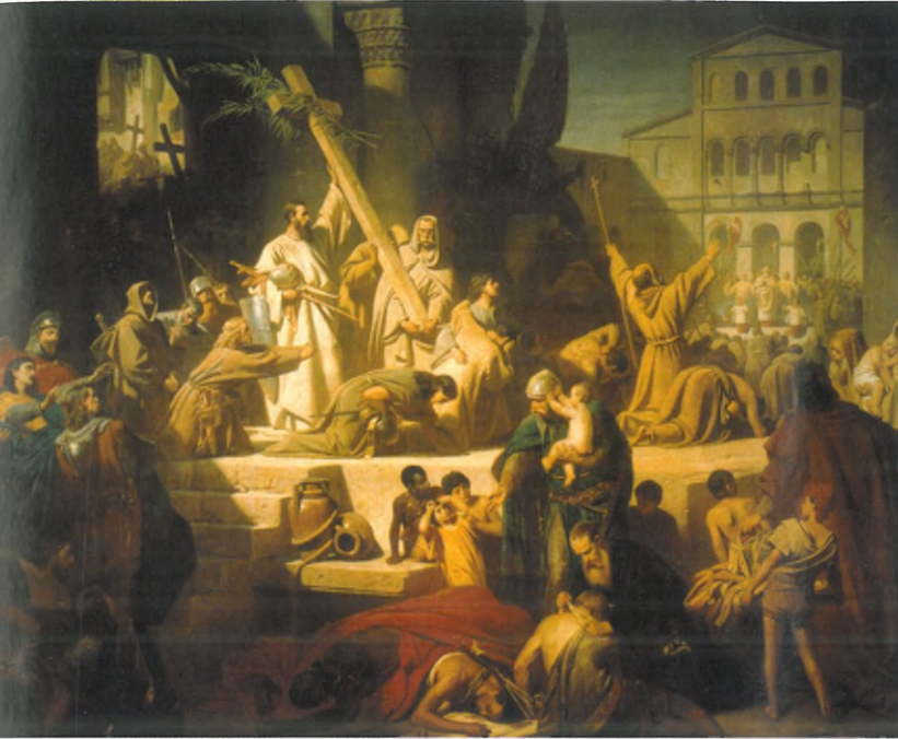
In 1099 slaagden de kruisvaarders van de eerste kruistocht onder leiding van Godfried van Bouillon erin Jeruzalem te veroveren. Nadat zij de moslims hadden afgeslacht, gingen zij huilend van vreugde naar de kerk van het Heilig Graf om daar God dank te zeggen.

eigenlijk niet konden. Natuurlijk moesten keizers vaak oorlog voeren – dat werd ook door de christenen erkend – maar het bleef een noodzakelijk kwaad. Rome zou pas een echt christelijk rijk zijn als het op de hele wereld vrede gebracht had. Augustinus (354-430), een van de grote christelijke theologen, meende dat een staat alleen oorlog mocht voeren als hij aangevallen werd, om zich te verdedigen. Nog in de 9e eeuw verkondigde paus Nicolaas I (858-867) dat oorlog in geval van zelfverdediging in uiterste gevallen misschien mogelijk was, maar dat het zelfs dan een duivelse zaak bleef, en dat deserteurs daarom met grote mildheid