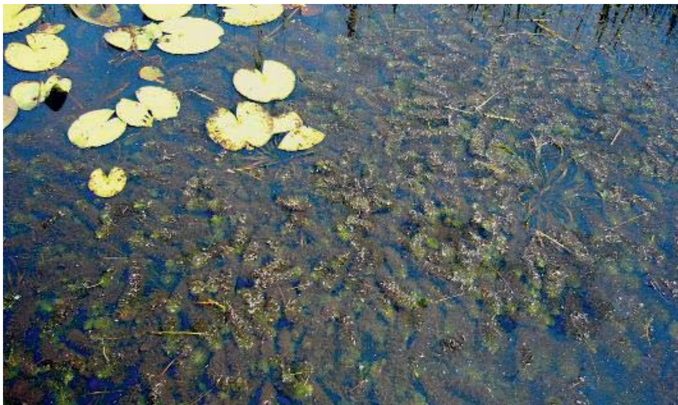
Woekering van grof hoornblad.

hoge fosfaatconcentraties bevat, zullen enkele snelgroeende soorten ondergedoken waterplanten gaan domineren, waardoor de soortenrijkdom laag blijft. Als de fosfaatconcentratie in de bodem laag is, blijft woekering uit en kunnen verschillende soorten ondergedoken waterplanten profiteren van de betere lichtbeschikbaarheid.