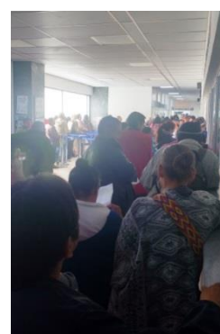
4to tramo. 8:00 a.m.

Me debato sobre cómo describir lo que sucede, no sé si catalogarlo como una cooptación de los afectos o algo similar, pero una hora después cuando es posible contar con los dedos de una mano la cantidad de personas que te separan de la ventanilla, ya no estás molesto, tu arrechera 21 se ha diluido en la fila, sólo estás desproporcionadamente feliz porque la espera ya va a terminar.