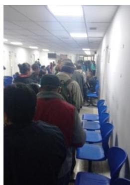
2do tramo. 7:10 a.m.