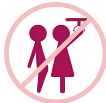
Imagen tomada de: aplicación móvil “Ellas”. Creada por: Red nacional de mujeres

¿Y ella por qué está hablando del acoso callejero si eso no es acto sexual ni mucho menos es violencia ? Digamos que, en sentido estricto, no se puede ser criminalizado por mirar a alguien, por muy baboso que se torne, pero esa mirada sádica también puede venir acompañada de insinuaciones libidinosas (de hecho, es bastante frecuente). Y eso, señoras y señores, sí es violencia sexual, pues ser obligada a escuchar o ver contenidos sexuales es una forma de violencia sexual (Red nacional de mujeres, App “Ellas”), lo que abarca la imposición del grito o gesto lascivo no deseado . Toquetear a alguien que no lo ha solicitado expresamente , también es violencia sexual. Así que un agarrón de nalga en el Transmilenio aplica, sépanlo para evitar hacerlo o para denunciarlo.