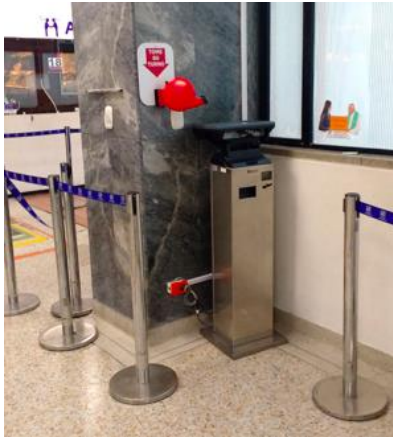
Kiosko Touch <Kaput>

pantalla. Por lo menos este “Turnomatic Reloaded” [invento propio] sí indica a la ventanilla a la que se debe proceder.