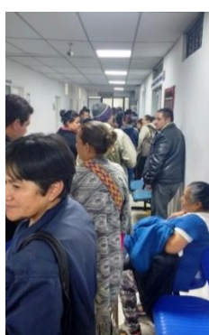
3er tramo. 7:30 a.m.