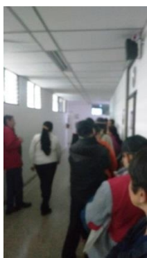
1er tramo. 6:50 a.m.

[Shouldn't we be rioting?!] [La chica que está justo detrás de mí lee un libro de proverbios y enseñanzas cristianas ¿será que Jesús multiplicará los cajeros para que avancemos más rápido o nos enviará a Moisés para que abra la fila y podamos pasar al frente?]