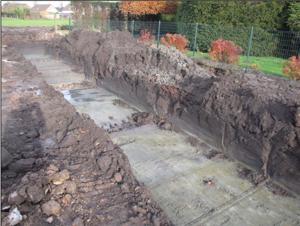
Fig. 10. Zicht op de proefsleuf langs de oostelijke rand van het voormalig slachthuis.