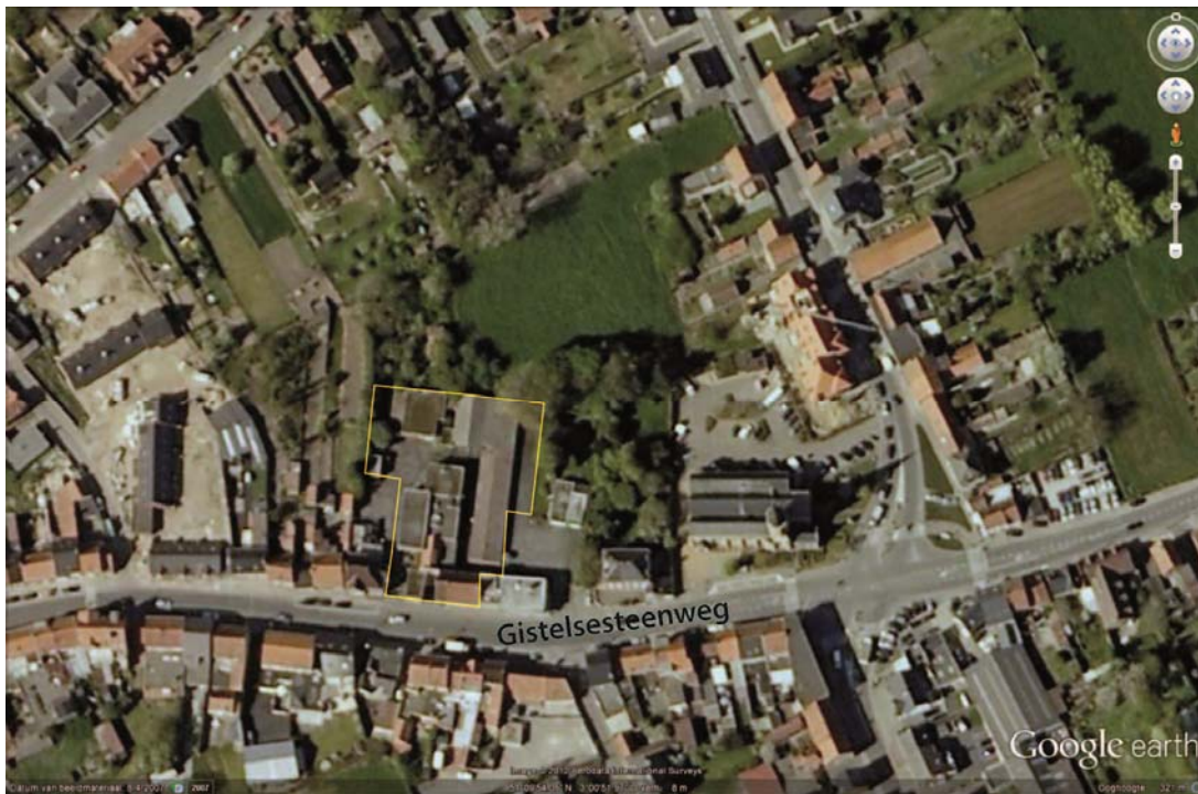
Fig. 4. Situering van de site 'Slachthuis Declerck' op de satellietfoto (situatie vóór de sloop).