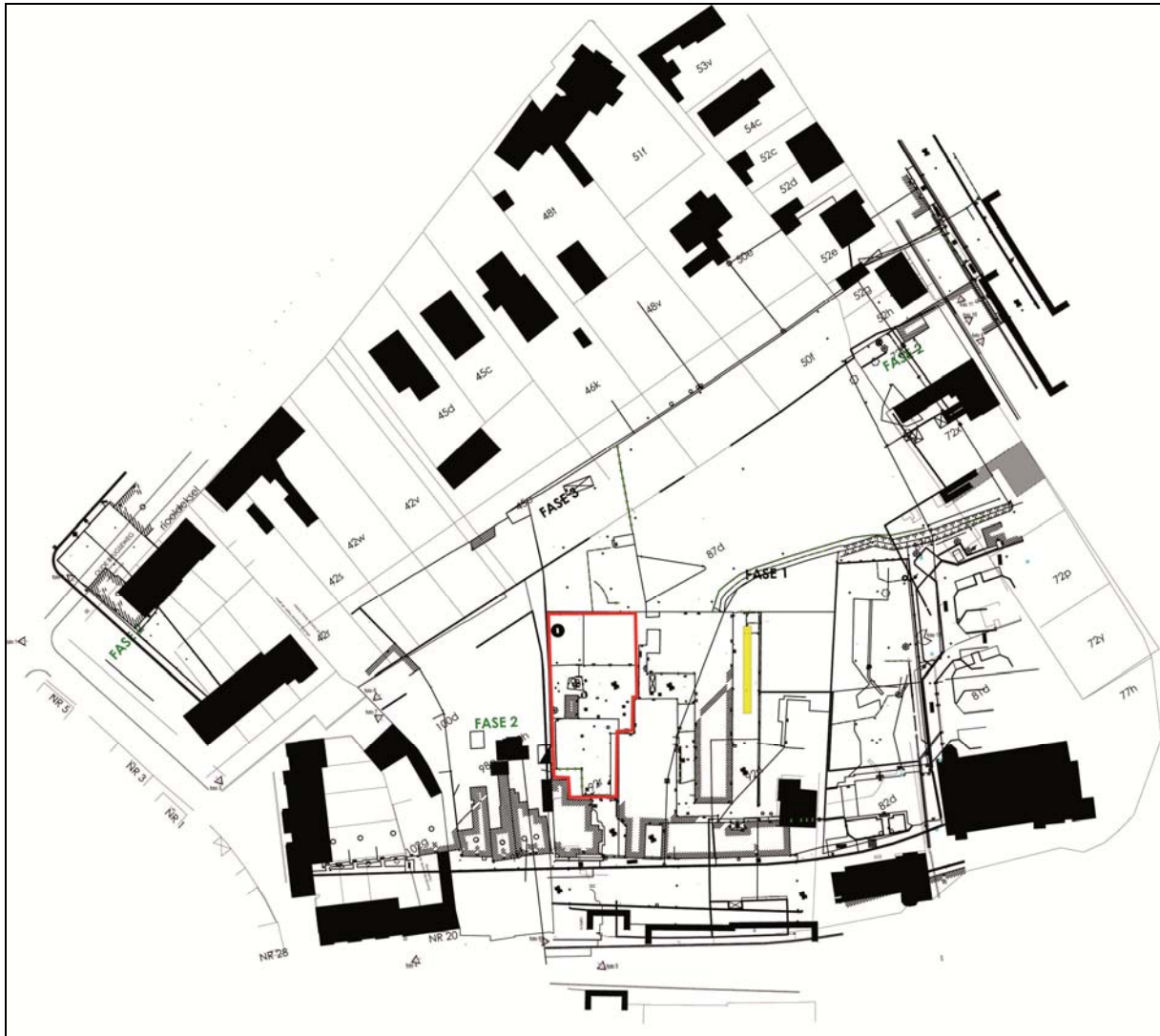
Fig. 9. Plangebied met in het geel de proefsleuf aangelegd langs de oostelijke rand van de site 'Slachthuis Declerck' en in het rood het minst verstoorde gedeelte van de site 'Slachthuis Declerck'.

Om toch enig inzicht te krijgen in de archeologische potentie van het terrein, werd langs de oostelijke rand van de site, een zone die slechts was afgedekt door een laag asfalt, een proefsleuf van ca. 2 op 22 m getrokken (fig. 9 en 10). Het moederzand werd bereikt op een diepte van ca. 60 cm. De originele podzol was door bioturbatie in de teellaag opgenomen. Op het grondvlak waren roestvlekken (oer), witgrijze vlekken (uitloging) en onderdelen van windvallen te zien. Archeologische sporen werden niet waargenomen.