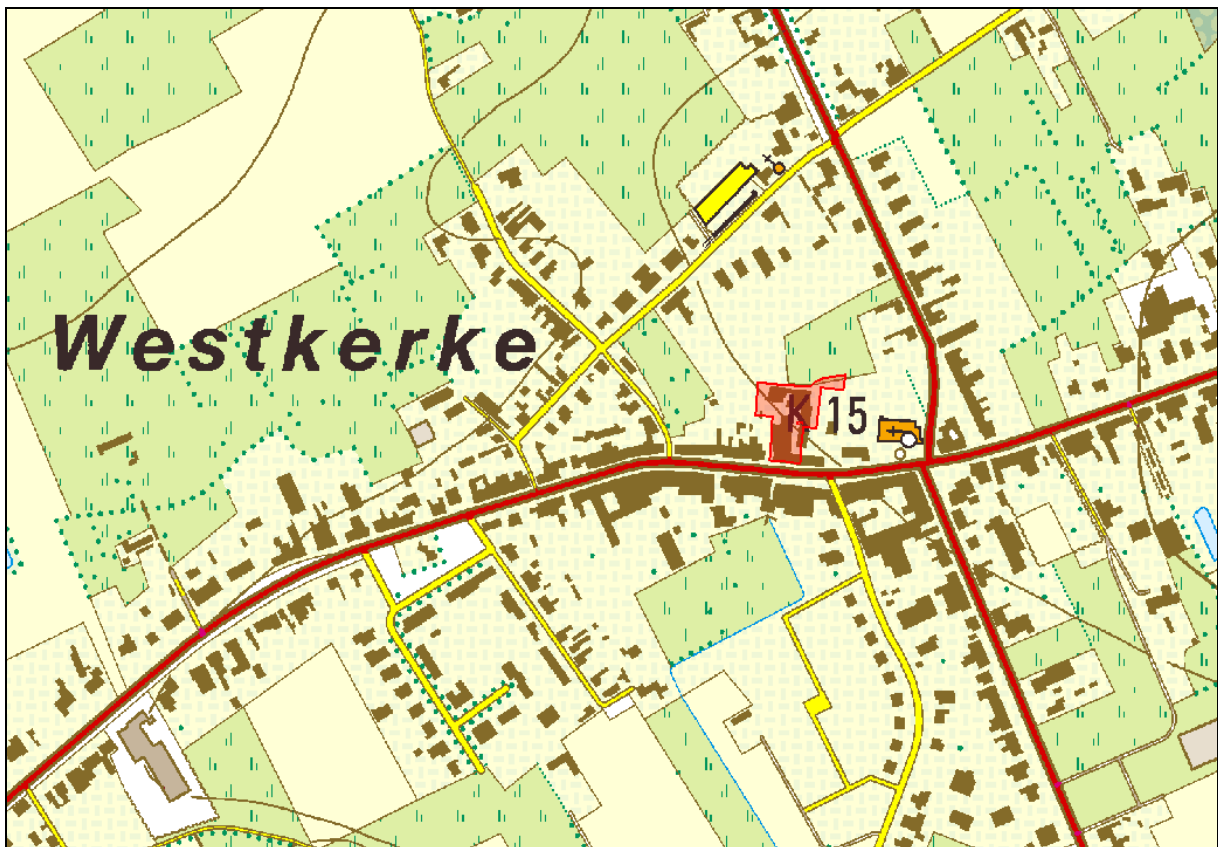
Fig. 1. Situering van de site 'Slachthuis Declerck' op de topografische kaart (situatie vóór de sloop). De terreinen van het voormalig slachthuis zijn in doorzichtig rood aangegeven.

De site werd gekocht door WoonWel cvba, een lokale sociale huisvestingsmaatschappij, die er 36 sociale woningen plant. Naast de site van het voormalig slachthuis werd ook het aanpalende weiland (Oudenburg, 4de afdeling, sectie B, perceel 87d), en enkele andere percelen langs de Vervlotenweg, Gistelsesteenweg en Westkerkestraat aangekocht (fig. 5). De werkzaamheden werden in drie fasen opgedeeld (fig. 5). De site 'Slachthuis Declerck' en aanpalend weiland vormen samen fase 1. Voor een betere afstemming ging fase 2 eerder van start dan fase 1. Op het moment dat de archeologische begeleiding van de sloop van het voormalig slachthuis plaatsvond, was men al bezig met het bouwen van huizen op de loten van fase 2. Fase 3 is gepland voor de toekomst.