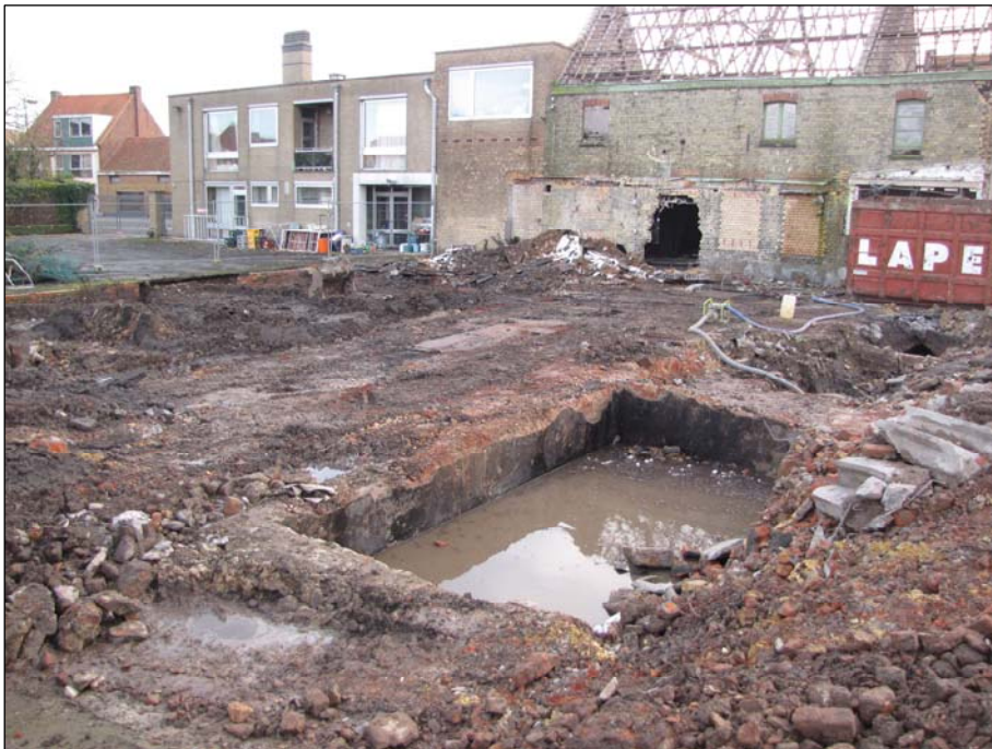
Fig. 7. Zicht op de zuidoostelijke hoek van de site 'Slachthuis Declerck' tijdens de sloopingswerken.

Op 19, 20 en 28 november 2012 werden de sloopingswerken begeleid. Al snel was duidelijk dat de mate van verstoring veel groter was dan aanvankelijk ingeschat. De funderingsmuren van het slachthuis waren opvallend diep (ca. 1 m, soms tot 1,50 m). Het terrein was verder doorspekt met kelders, waterputten en diverse rioleringen en afvoeren (fig. 7 en 8). De begeleiding werd bemoeilijkt door het slechte weer (overvloedige regenval). Doordat de VMW de afvoer naar de Gistelsesteenweg had afgesloten, kon het regenwater niet weg en moest het terrein tijdens de sloopingswerken meermaals worden bemaald. Door het waterverzadigde karakter van het terrein heeft de kraan zo goed als niets onaangetast kunnen laten.