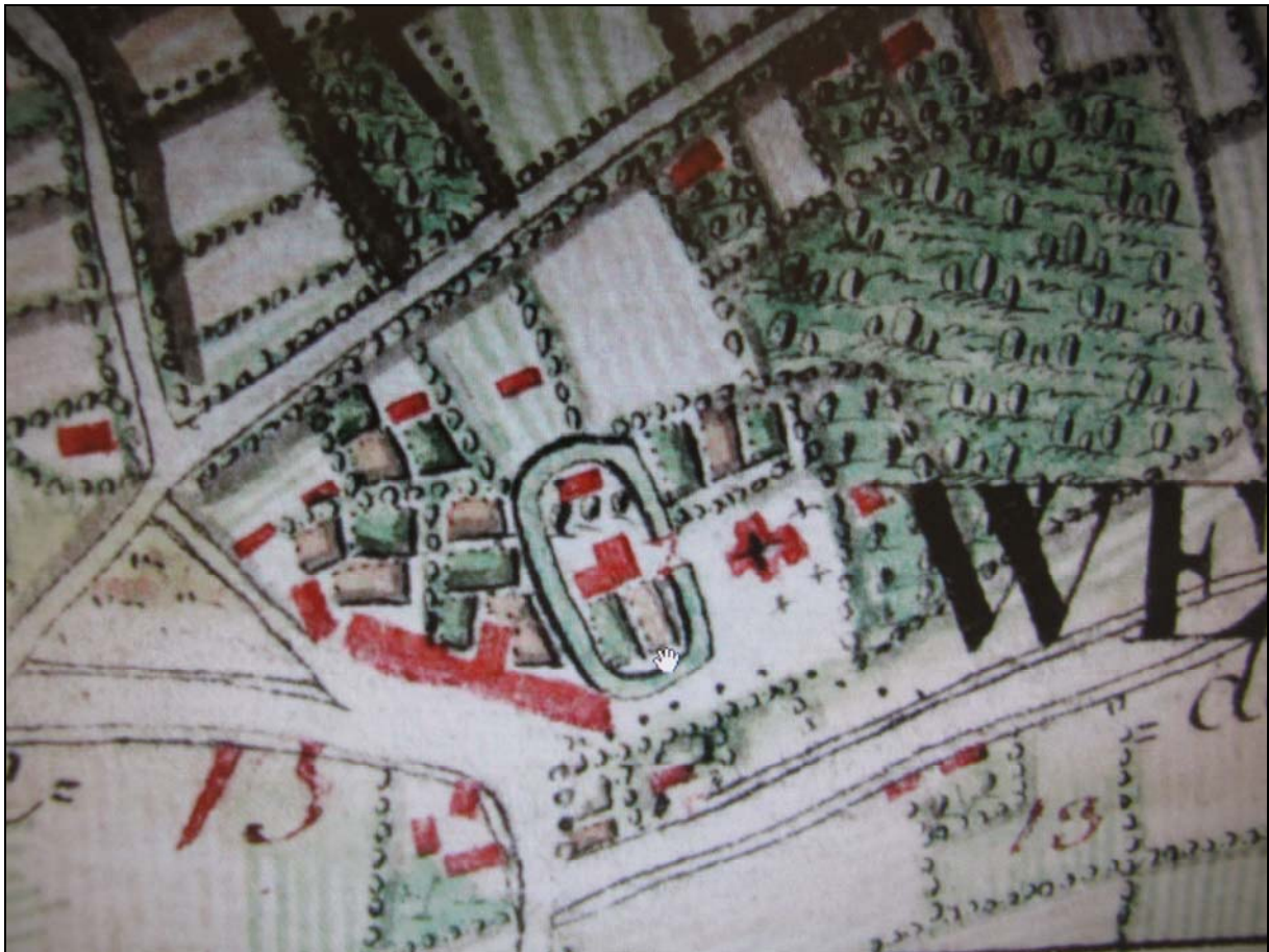
Fig. 6. Uittreksel uit de Kaart van Ferraris met centraal de kerk van Westkerke, links daarvan een door een ovaalvormige gracht omgeven boerderij. De site 'Slachthuis Declerck' ligt deels op deze boerderij.

Om een aantal specifieke redenen werd een archeologische opvolging als relevant beschouwd. De site bevindt zich in de historische kern van Westkerke. Over de geschiedenis van Westkerke is niet veel geweten. Het toponiem verraadt dat Westkerke als nieuwe kern westwaarts van Roksem moet zijn ontstaan. Dit gebeurde vermoedelijk in de achtste eeuw. De oudste vermelding van Westkerke duikt op in een document uit 877. De Sint-Audomaruskerk gaat wellicht teruggaat tot een vroegmiddeleeuwse bidplaats (Meulemeester 1988, 73-74). Er kan worden vermoed wordt dat er ten laatste vanaf die periode (9de eeuw) rondom de kerk verspreide of geconcentreerde bewoning lag. Op de Ferrariskaart (1777) is in de zone ten westen van de kerk licht geconcentreerde bewoning vast te stellen (fig. 6). De zone omsloten door de Oude Brugseweg in het noorden, de Vervlotenweg in het westen en de Gistelsesteenweg in het zuiden omvat de kerk, akkerland, licht geconcentreerde bewoning met bijhorende moestuinen en ten westen van de kerk een door een brede, ovaalvormige gracht omgeven boerderij. Deze bewoning kan worden bestempeld als een hoeve met walgracht. Van belang is dat de site 'Slachthuis Declerck' deels op deze boerderij moet worden gesitueerd.