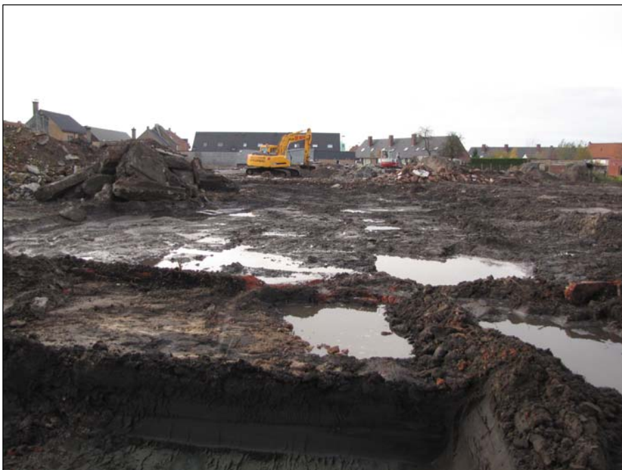
Fig. 8. Zicht op de noordelijke zijde van de site 'Slachthuis Declerck' tijdens de sloopingswerken.