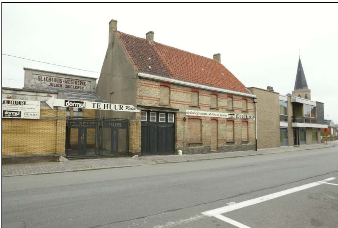
Fig. 2. Zicht op de voorzijde van de site 'Slachthuis Declerck' met bijhorende woning (Oudenburg, Westkerke, Gistelsesteenweg 8-10). Bemerkt rechts op de foto de torenspits van de kerk van Westkerke.