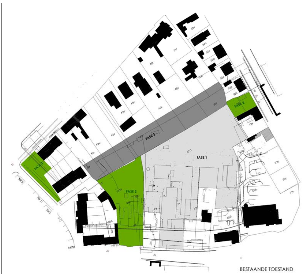
Fig. 5. Kadasterplan met de fasering van de werken. De site 'Slachthuis Declerck' en aanpalend weiland vormen samen fase 1.