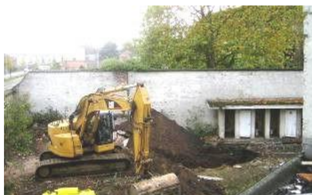
De binnenplaats van het voormalige arresthuis, gefotografeerd van op de eerste verdieping, tijdens het graven van de proefsleuf. Links op de achtergrond is de Tinellaan zichtbaar (Mechelen - stedelijke dienst Archeologie).

De proefsleuf mat ongeveer 6m lang en 2m breed. Omdat de sleufwanden dreigden in te kalven, werd niet dieper gegraven van ca. 2,25m onder maaiveld. De zuidwestelijke sleufwand werd quasi loodrecht afgestoken, terwijl de noordoostelijke wand getript werd aangelegd in functie van toegankelijkheid en veiligheid.