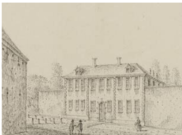
Het arresthuis of de nieuwe gevangenis in 1845 door J.B. De Noter. Links op het voorplan bevindt zich een gevel van de infanteriekazerne, de latere Dossinkazerne (Mechelen - Stadsarchief).

Nadat de stedelijke gevangenis eeuwenlang was ondergebracht in de stadshalle aan de Grote Markt, werd in 1830-1831 vlak tegenover de infanteriekazerne -de latere Dossinkazerne- een nieuw arresthuis gebouwd. Voordien stonden op deze plaats twee herbergen die door de soldaten van de nabije kazernes werden bezocht. Het gebouw bleef in gebruik als gevangenis tot 1874, toen aan de Liersesteenweg een nieuwe rijksgevangenis verrees. Het gebouw werd vervolgens ingericht als militaire bakkerij. Vanaf de jaren 1960 tot het begin van de 21 ste eeuw deed het voormalige arresthuis dienst als schoolgebouw. Sindsdien staat het gebouw leeg.