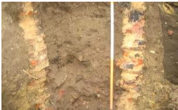
De bakstenen muurtjes die wellicht de hoek van een constructie vormden, mogelijk een beerput. De binnenruimte bleek gevuld met o.a. puin, dierlijk bot en aardewerk.