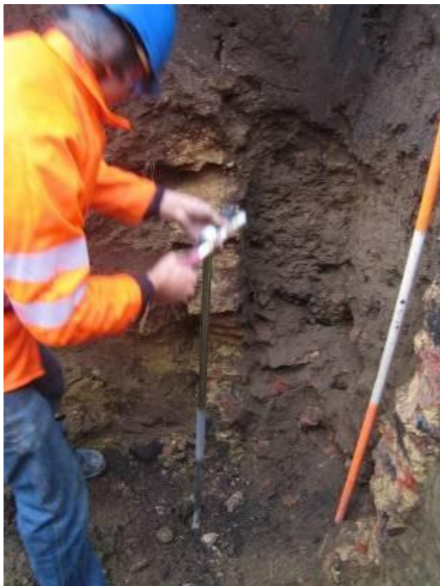
Boring met een Edelmanboor in de zuidelijke hoek van de proefsleuf (Mechelen - stedelijke dienst Archeologie).

Aangezien er om veiligheidsredenen (inkalvingsgevaar) niet dieper kon gegraven worden dan 2,25m onder maaiveld en omdat de opeenvolging van archeologische lagen zich duidelijk nog een stuk dieper doorzette, werd besloten om de bodemopbouw verder in kaart te brengen door middel van een boring (Edelmanboor met een diameter van 7cm). De boring werd gezet in de zuidelijke hoek van de sleuf. Het donkergrijze, puinrijke pakket liep door tot een diepte van ca. 2,70m onder maaiveld, om dan plots over te gaan in een pakket geelgrijs, puinarm zand. Op een diepte van ca. 3,00m werd nog wat houtskool aangetroffen. Tenslotte werd op ca. 3,40m onder maaiveld de overgang gevonden naar wat mogelijk als moederbodem geïdentificeerd kan worden: een pakket lichtgeel, grofkorrelig zand, zonder zichtbare bijmenging van archeologisch materiaal. In tegenstelling tot veel andere locaties in de Mechelse binnenstad bleek de bodem zelfs op meer dan 3,00m onder maaiveld nog bijzonder goed ontwaterd.