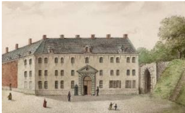
De infanteriekazerne, de latere Dossinkazerne, en de restanten van de Kerkhofpoort in 1812, met rechts daarvan een trapje dat langs de stadswal omhoog leidt.

In 1756 werd aan de overkant van de Kerkhofstraat een infanteriekazerne opgetrokken, waar naast infanteristen ook andere militairen gelegerd waren. In 1936 kreeg de kazerne de naam Dossin, naar de luitenant-generaal van het regiment dat er was ingekwartierd. Tijdens WOII deed het gebouw dienst als verzamelplaats vanwaar joden gedeporteerd werden. Nadien kreeg de kazerne opnieuw een militaire functie, en dit tot 1973. Uiteindelijk werd in 1987 ook dit gebouw als monument beschermd.