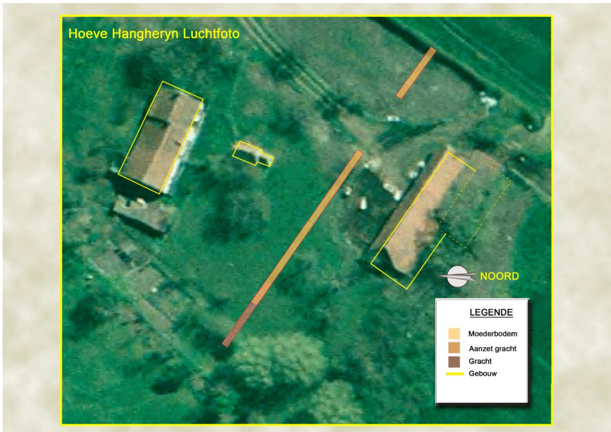
Fig. 5: Situering op een luchtfoto