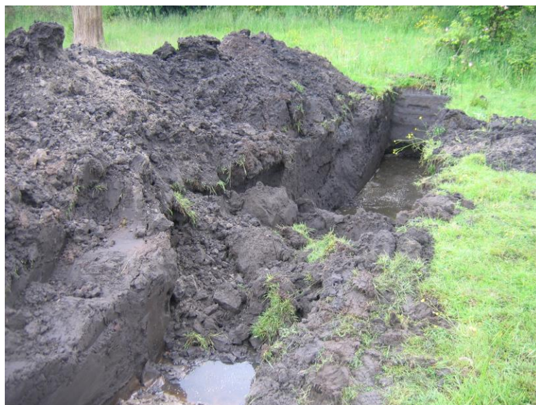
Fig. 3: Zicht op de gracht

Aan de noordoostzijde werd de gracht deels aangesneden. Bij de aanzet van de gracht gaat deze minder dan 1 meter diep, vanaf de eigenlijke gracht werd in de onderzochte zone de diepte vastgesteld tot ca. 1,90 meter. In de gracht werden enkele scherven rood aardewerk aangetroffen, deze mogen gedateerd worden in de 16 de en de 17 de eeuw. Wegens stabiliteitsproblemen van de sleufwanden en de drassige ondergrond kon geen profiel van de gracht worden ingetekend.