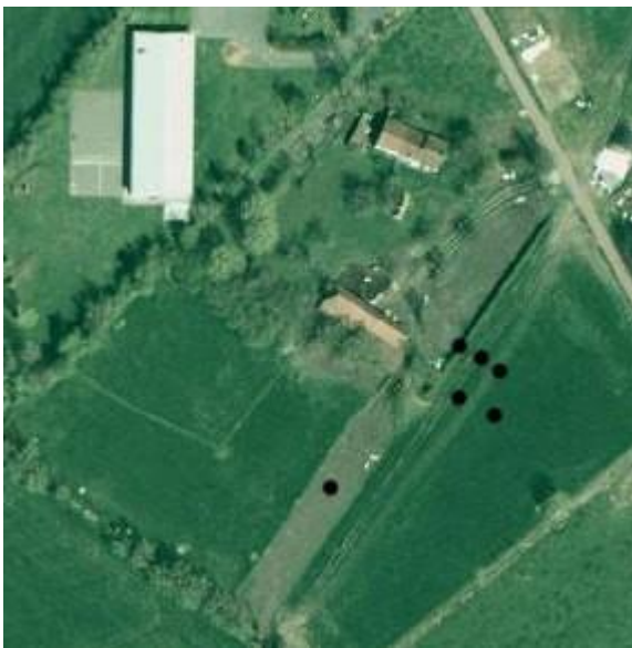
Fig. 6: localistaie van de boringen

Kristel Soers interpreteert, in de archeologische inventaris Vlaanderen (band IX), op de kaart van Pourbus (1561-1571) een ca. vierkante walgracht. Ze besluit dat het een site met walgracht betreft, waarvan de walgracht reeds vroeg zijn nut zou verloren hebben en zodoende reeds grotendeels voor het einde van de 18 de eeuw verdwenen zou zijn. Toch werd tijdens het proefonderzoek slechts aan één zijde een gracht aangesneden. Om de mogelijke vierkante walgracht te onderzoeken werd besloten aanvullend enkele boringen uit te voeren op het aanpalend terrein. In totaal werden 6 boringen uitgevoerd. In elke boring bevond het Pleistoceen zand zich reeds tussen de 70 en 90 cm diepte. De vermoedelijke gracht werd nergens teruggevonden. Vermoedelijke was de site dus slechts deels omwald.