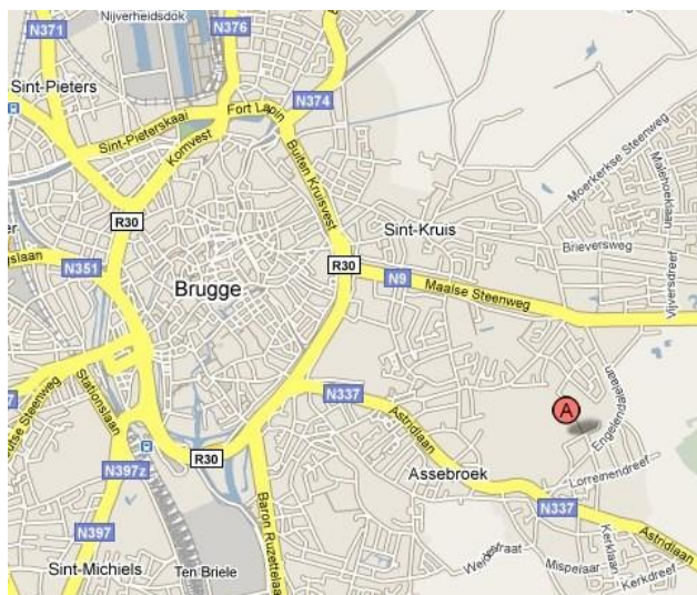
Fig. 1: Situering van de hoeve op het hedendaags stratenplan.

Hoeve Hangheryn is gelegen aan de Gemeneweideweg Zuid 113 te Assebroek, Brugge.