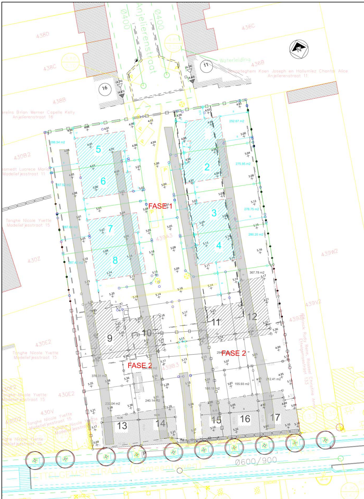
Fig. 2. Ontworpen toestand riolerings- en wegenisplan met positie van de proefsleuven (bleekgrijze opvulling).