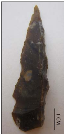
Fig. 8. Werktuig in silex.