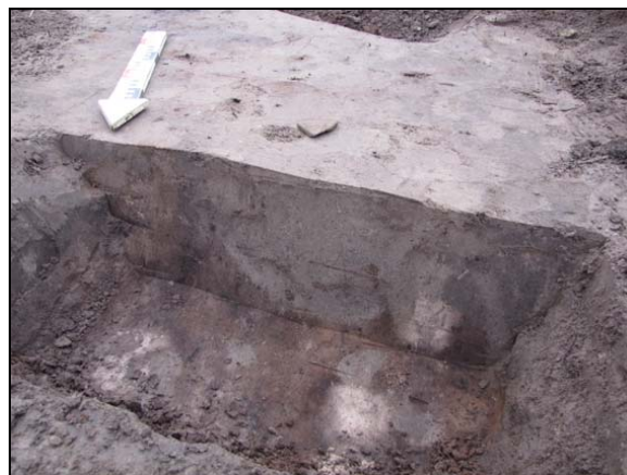
Fig. 9. Proefsleuf 3. Coupe door paalspoor S5.