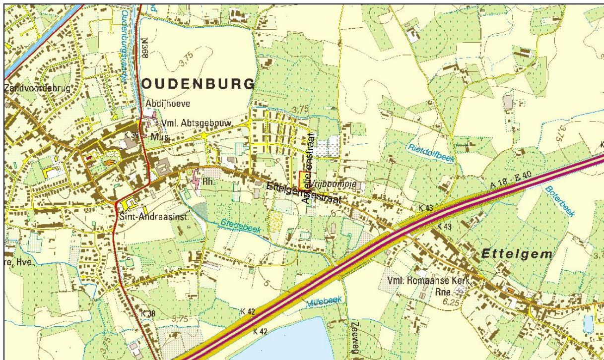
Fig. 1. Uittreksel uit de topografische kaart. De verkaveling is in doorzichtig geel aangeven.