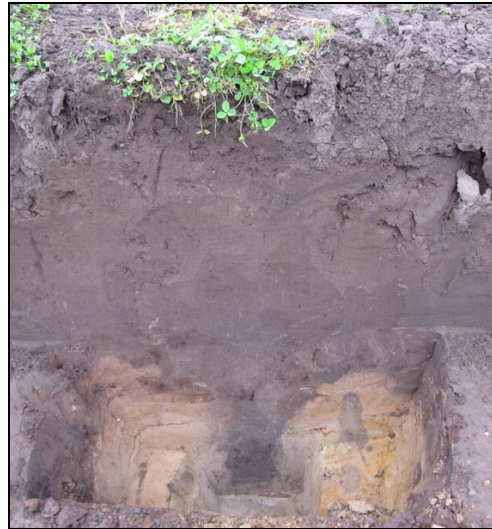
Fig. 7. Proefsleuf 4. Westprofiel. Coupe door paalspoor S6.