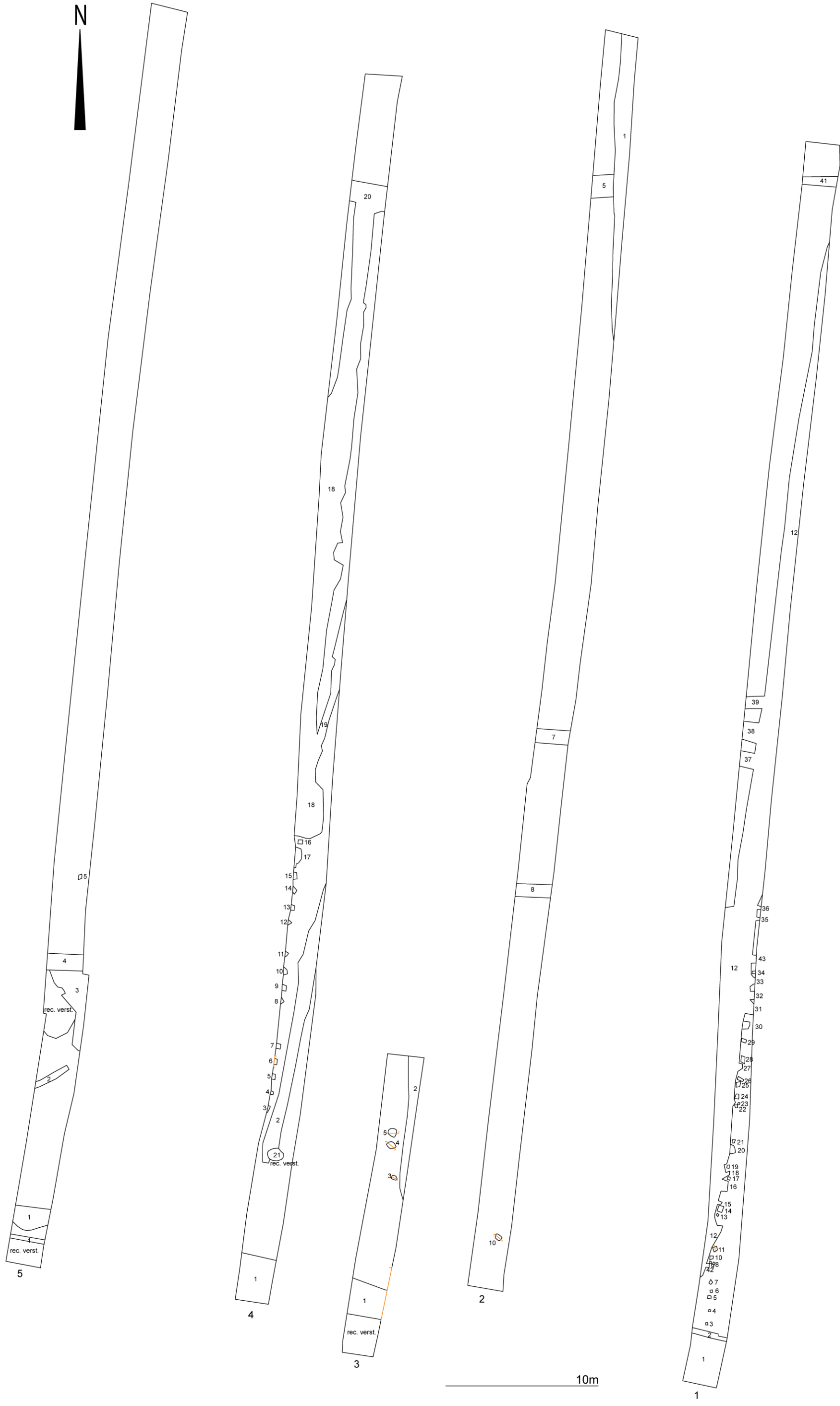
Fig. 3. Kaart met de contouren van de proefsleuven en de aangetroffen sporen.