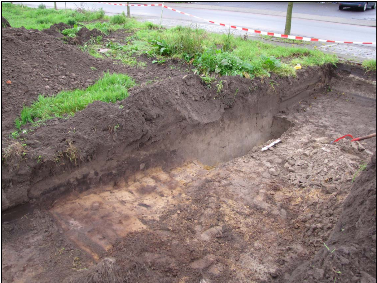
Fig. 4. Proefsleuf 3. Oostelijk profiel. Zicht op grachten S1a en S1b.

Niettemin het waarderend onderzoek interessante gegevens heeft opgeleverd, is vervolgonderzoek niet nodig. De afwezigheid van concentraties van gebouwsporen uit de middeleeuwen en andere periodes en/of de afwezigheid van andere interessante structuren maakt het weinig zinvol om de zones tussen de proefsleuven aan een verder onderzoek te onderwerpen.