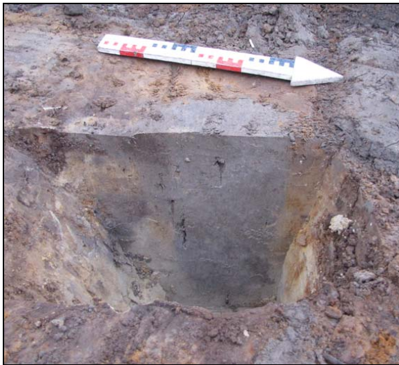
Fig. 6. Proefsleuf 1. Coupe door paalspoor S11.