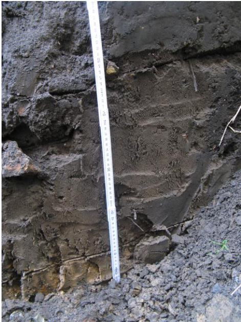
Fig. 2: Opbouw van sleuf I, met onderaan het Pleistoceen zand, daarboven de bruine zandige laag en daarboven de verstoorde bodem.