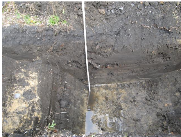
Fig. 3: zicht op de profielwand van sleuf II

De bovendste 75 cm bestonden uit verstoorde bodem, daaronder een bruine zandige laag van ca. 20-25 cm dik. In deze zandige laag bevond zich een concentratie van dierenbeenderen. Op ca. 100 onder het loopvlak bevond zich het pleistoceen zand. Op deze diepte bevond zich ook de grondwatertafel.