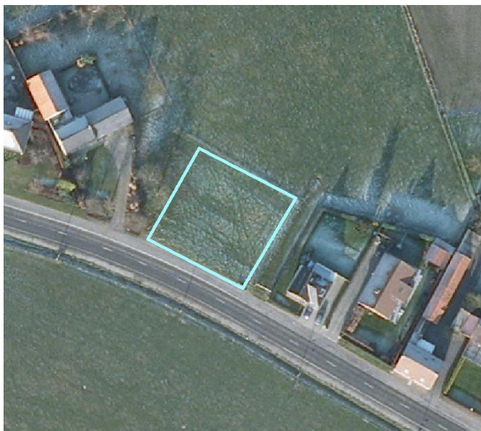
2 Lokalisatie van het te onderzoeken terrein op de orthofoto.

De proefsleuven werden geschrinkt getrokken volgens een grid van 10m op 10m dat zich over het ganze terrein uitstrekte.