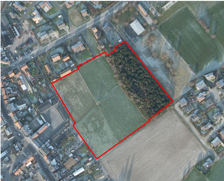
2 Lokalisatie van het te onderzoeken terrein op de orthofoto.