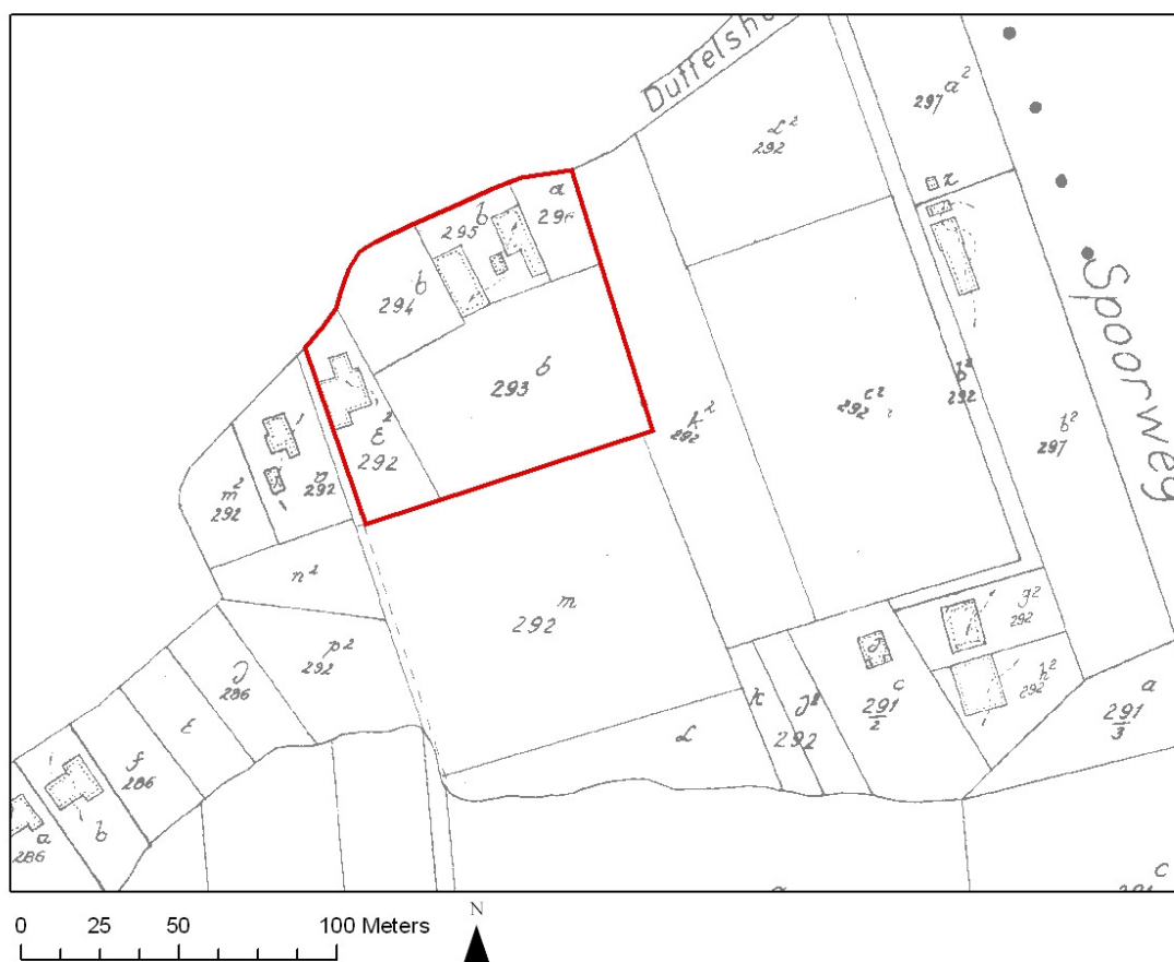
Fig. 1 Kadastrale kaart.

Volgens de bodemkaart bestaat de ondergrond uit matig gleyige zandleemgronden met textuur B horizont (Lda) met een klei-zandsubstraat beginnend op geringe of matige diepte.