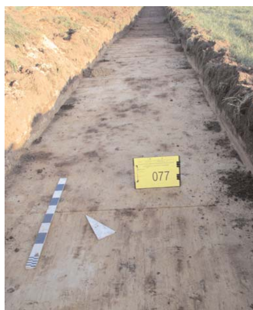
Afbeelding 5: Vlakoverzicht van het klei-zandsubstraat (w-Seg) in sleuf 5 sector X.