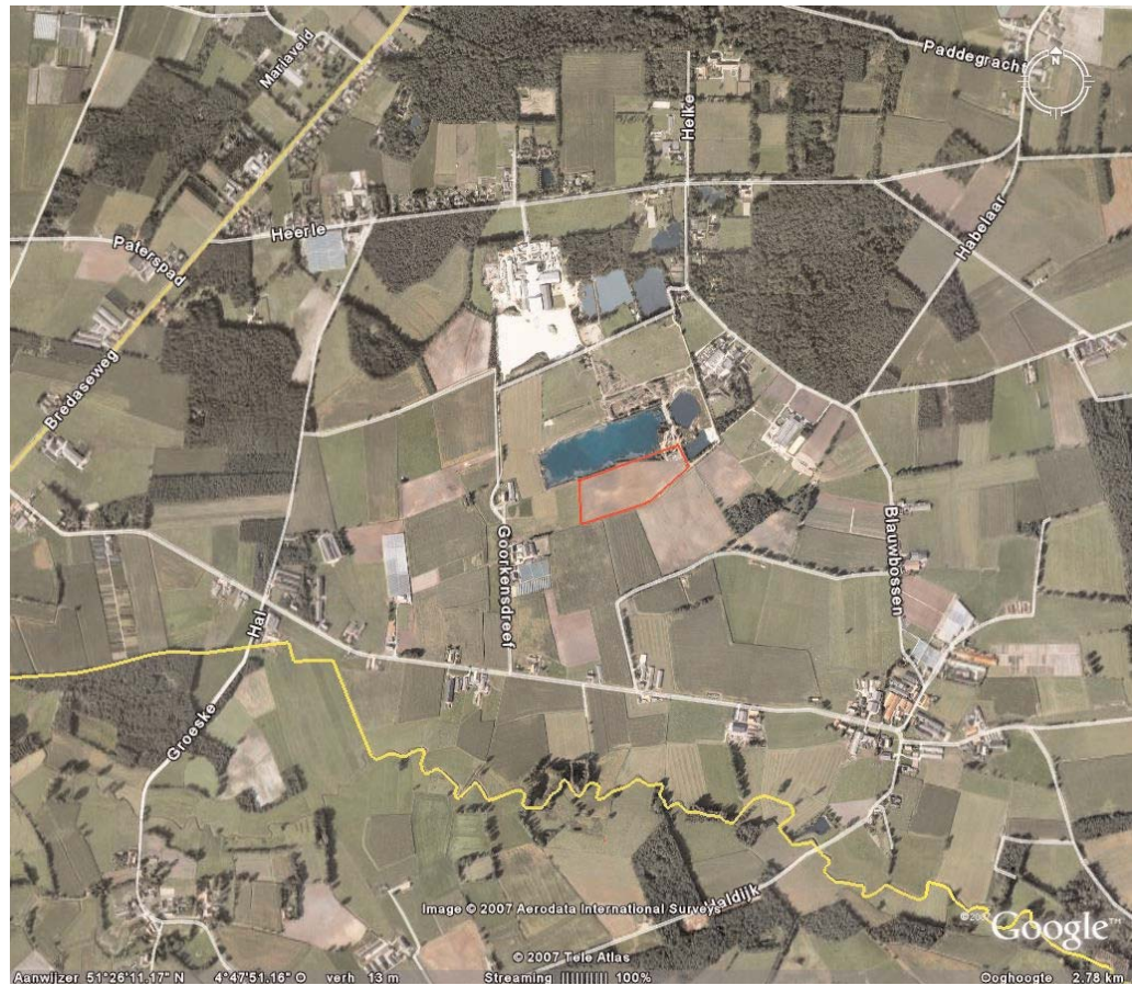
Afbeelding 1 : Ligging plangebied (met rode contouren) aan de Goorkensdreef te Hoogstraten-Minderhout (Bron: internetsite Google Earth).