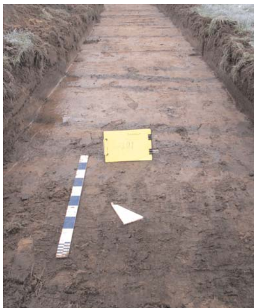
Afbeelding 4: Vlakoverzicht van de zeer natte zandgronden (Zfg) in sleuf 7 sector V.