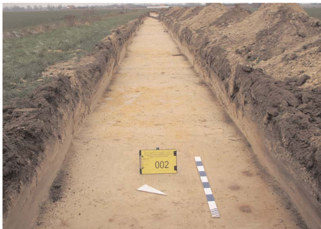
Afbeelding 3: Vlakoverzicht van de matig natte zandgronden (Zdg) in sleuf 1 sector II.