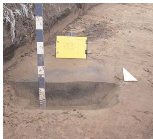
Afbeelding 9: Overzicht coupe spoor S037 in sleuf 7 sector III.