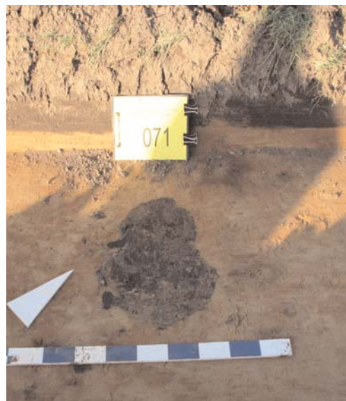
Afbeelding 7: Spooroverzicht spoor S033 in Sleuf 4 sector X.