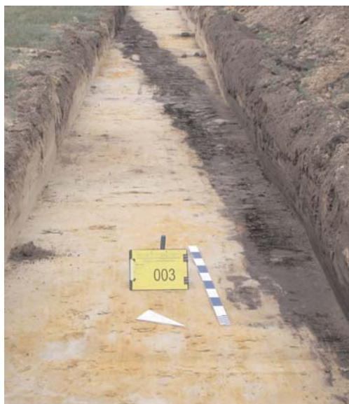
Afbeelding 6: Spooroverzicht van de (sub) recente greppel S001 in sleuf 1 sector III.