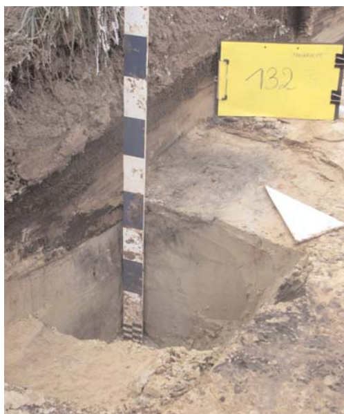
Afbeelding 8: Overzicht coupe spoor S034 in sleuf 6 sector III.