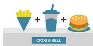
Рис. 2 – Задачі Cross-selling

Суть задач cross-selling (рис. 2), зводиться до рекомендації супутніх товарів і послуг для користувачів, які вже здійснювали певні покупки чи замовляли певні послуги. У результаті пропозиції товарів чи послуг зростають продажі товарів, а отже і прибуток організації. Основною проблемою при рекомендації cross-товарів є визначення подібних товарів або подібних покупців.