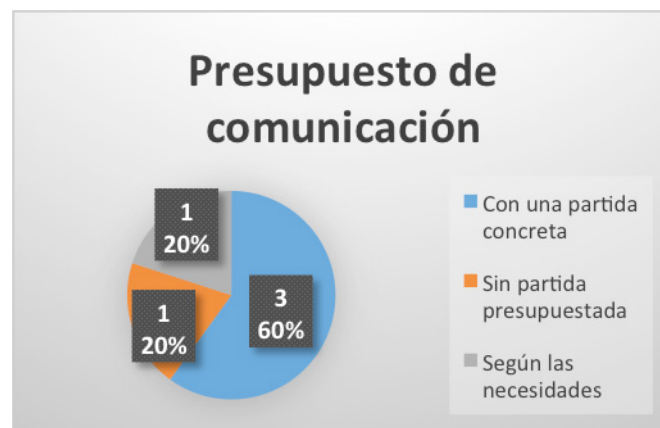
Figura 3. Presupuesto de comunicación

También puede estudiarse la presencia de partidas tiene una cantidad definida, y Monachil, a pesar de no presupuestarias que, en este caso, no coincide con la contar con gabinete, sí que tiene fijada una partida. presencia de gabinetes: Maracena, con gabinete, no Se muestra en la Figura 3.