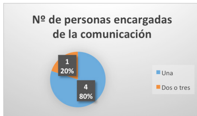
Figura 4. Número de personas que trabajan la comunicación en los municipios