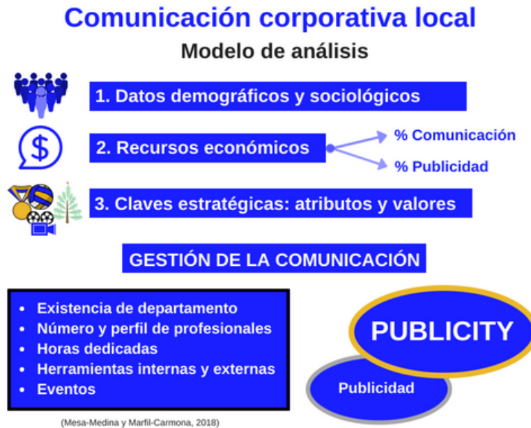
Figura 1. Resumen de la herramienta de análisis propuesta