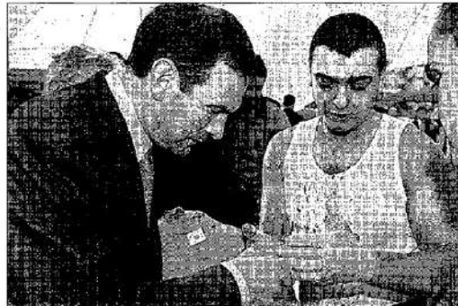
Juan José Ibarretxe observa las manos de un levantador de piedras

Juan José Ibarretxe quiere que las víctimas del terrorismo sean las protagonistas de la manifestación contra ETA que ha convocado para el próximo día 21 en Bilbao, pero el Colectivo Vasco de Víctimas del Terrorismo así como la AVT han dejado claro que no participarán en esa marcha, que han tachado de «oportunistista». PP y PSE han condicionado su participación al lema de la misma, que no se conoce.