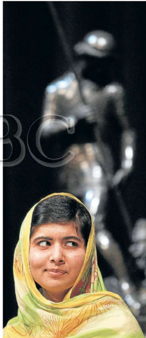
Malala, tras recibir un premio en Barcelona el pasado mes de julio

La noticia del galardón de la Unión Europea, por delante de otros nominados como Edward Snowden, el exinformático de la NSA y los presos políticos bielorrusos Ales Bialiatki, Eduard Lobau y Mykola Statkevich, apenas tuvo eco en la prensa paquistaní. «Los medios en inglés la ignoran y los medios en urdu directamente la tachan de agente de la CIA. Para