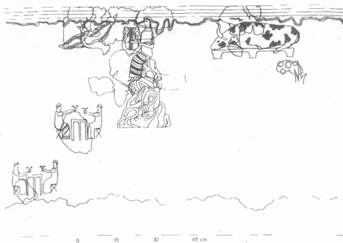
Fig. n.º 59.- Pilo (Mesenia, Grecia). S. XIII a.C. Dibujo reconstructivo. Según L. R. McCallum.

presidido por una paloma en pleno vuelo (Lang, 1969:79-81). El eje central de la celebración gira en torno al toro sacrificado, que yace sobre una mesa. Ha de suponerse que su carne constituye el principal manjar del ágape. Un tañedor de lira ameniza con su música el acto (Fig. n.º 59). También la cerámica minoica combinó motivos decorativos a base de aves, cuernos de consagración e incluso músicos, en clara alusión a la ideología religiosa (Marinatos, 1993: 138-139).