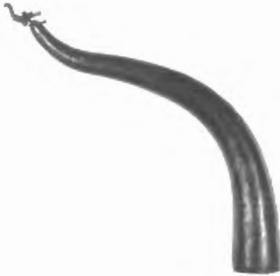
Fig. n.º 58.- Asta de toro con pájaro . Son Corró (Costitx, Mallorca). S. IV a.C. Museo Arqueológico Nacional (Madrid).

Los refinados y hermosos toros de Costitx resumen toda esta antigua tradición, que encarnó en esta especie valores esencialmente masculinos como virilidad, fuerza, valor y potencia genésica. Así se le erigió en mensajero y símbolo de lo divino. La aparición de pequeños pájaros en bronce, bien sueltos, bien rematando astas o vástagos del mismo metal, sugiere la presencia de la