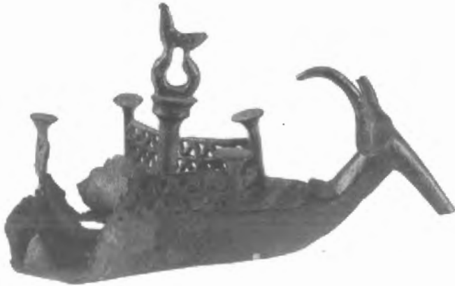
Fig. n.º 61.- Barca con prótomo bovino . Mandas (Cagliari, Cerdeña). S. X-IX a.C. Museo Arqueológico Nacional (Cagliari).

La asociación de reses y pájaros también estuvo presente entre los sardos. Figuritas variadas se encuentran diseminadas por sepulturas y recintos sagrados, aunque tal vez donde se ilustra de un modo más claro es en unas navecillas de bronce o terracota, dedicadas como objetos votivos. Estas pequeñas embarcaciones lucen en su proa prótomos taurinos, de largos cuernos y hocico estrecho y afinado (Lilliu, 1966: