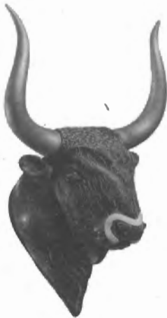
Fig. n.º 56.- Ritón taurino . Cnoso (Creta). Ca. 1500 a.C. Museo de Iraclion.