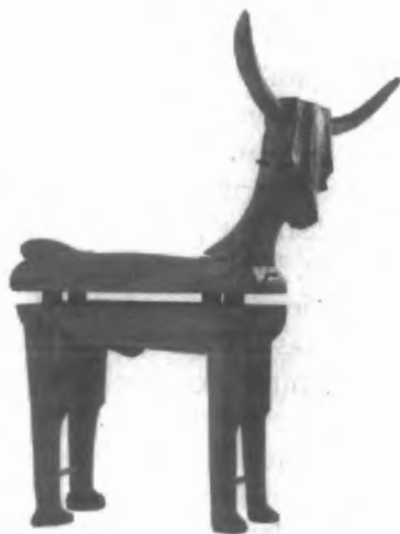
Fig. n.º 60.- Sarcófago tauomorfo . Avenc de la Punta (Pollensa, Mallorca). Ca. 310-110 a.C. Reconstrucción. Museo Municipal de Pollensa.

A partir de los fragmentos encontrados se han llevado a cabo tareas de reconstrucción, lográndose reproducir uno de