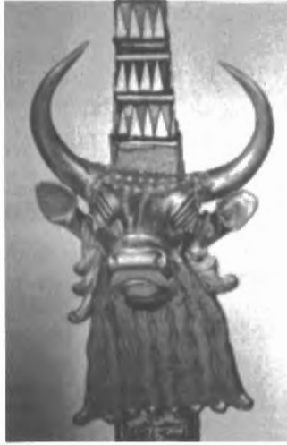
Fig. n.º 55.- Arpa taurocéfala . Ur (Iraq). Ca. 2250 a.C. Museo de Iraq (Bagdad).