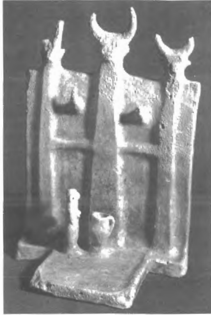
Fig. n.º 57.- Maqueta de santuario . Kotchati (Chipre). Ca. 2000 a.C. Museo de Chipre (Nicosia).

Muestra de ello es la pequeña reproducción en terracota, descubierta en una tumba de la necrópolis de Kotchati, Nicosia (Karageorghis, 1970: 10). Representa un santuario, de cuyo muro central sobresalen un par de astas bovinas y tres postes, tal vez de madera, cubiertos en su cúspide por tres cabezas de toro. Es