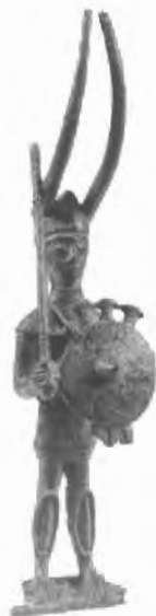
Fig. n.º 62.- Guerrero . Senorbi. (Cerdeña). S. X-IX a.C. Museo Arqueológico Nacional (Cáller).

Algún estudioso mantiene la hipótesis del parentesco de estos barquitos con los hippoi gaditanos (Luzón, 1987). Estos navíos protegían la cubierta de las inundaciones con pieles de animales y mostraban como emblema de identificación prótomos zoomorfos, entre los que no podrían faltar los de bovino. La