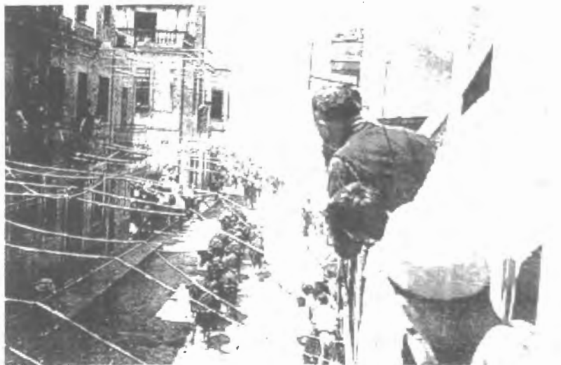
Fig. n.º 49.— Encierro de Toros en el Grao d'Amposta  (Apud.: González, 1996: 162).

protección de los animales que, a la postre, no tan sólo ha servido para limitar las corridas y demás fiestas populares con toros, sino que ha sido utilizada también como un perspicaz dispositivo de estigmatización de los taurófilos catalanes.