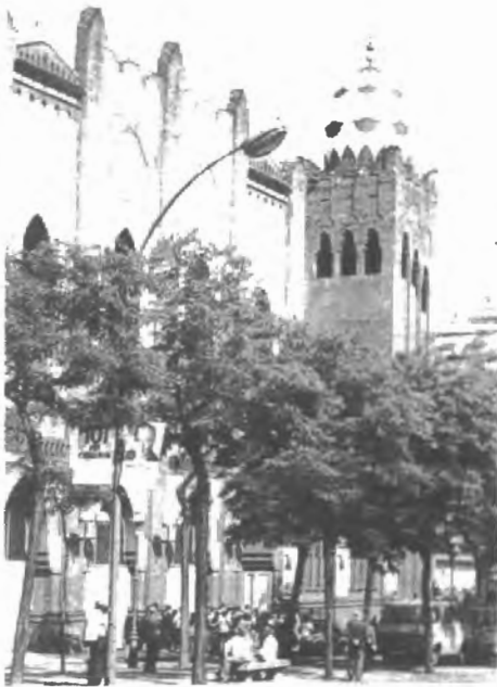
Fig. n.º 50.— Plaza de Toros Monumental de Barcelona (Apud.: González, 1996: 203).

calificó a la ciudad de « capital de la Catalunya catalana », el archivo municipal ocultaba la documentación que prueba la vieja tradición taurina de la capital de la comarca de