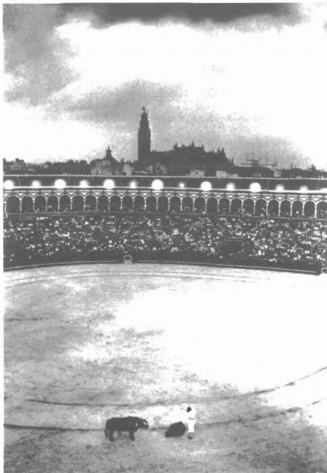
Fig. n.º 36.— Aya, Atín: La Maestranza, al atardecer, con la Giralda y la Catedral al fondo (Apud.: Aya, 1996: lám. 57).