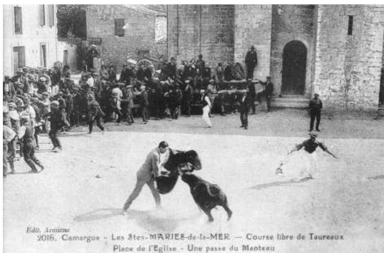
Fig. nº 47.— En los años 1920, pase de capote atribuido a Henry de Montherlant metido en el lío de la fiesta popular camarguesa.