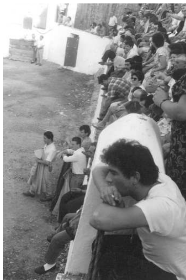
Fig. nº 51.— Copea en la Sierra de Huelva.