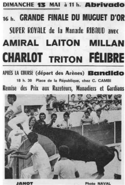
Fig. nº 46.— Cartel de una corrida camarguesa: los nombres de los toros están escritos en letras grandes porque las reses son, al igual que los matadores españoles, héroes de este peculiar espectáculo taurino.

Manifiestamente, y sólo con observar el papel desempeñado por el toro, la forma local del espectáculo taurino se oponía al de la corrida española y es muy probable que esta tendencia, cuyo carácter sistemático tuvimos ya ocasión de