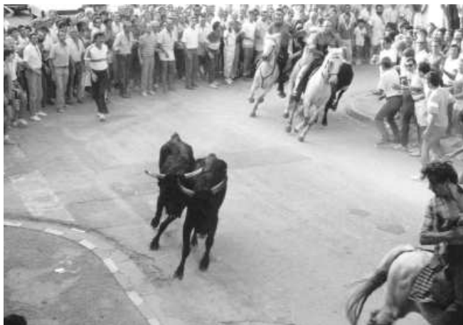
Fig. nº 44.— Corrida camarguesa: bandido.