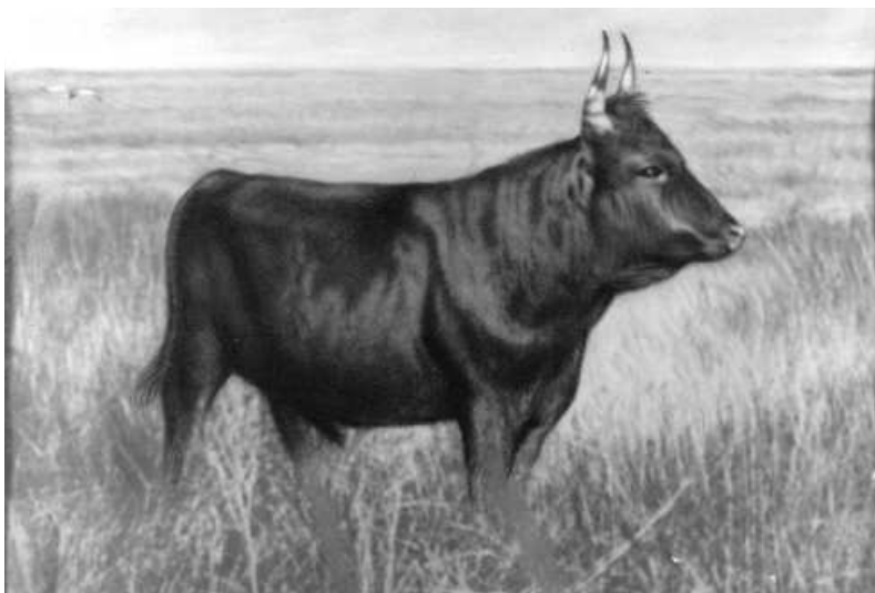
Fig. nº 49.— Prouvenço , el parangón de la pura raza camarguesa, concebida por el manadier felibre , el Marqués de Baroucelli-Javon.