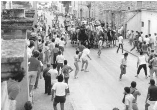
Fig. nº 43.— Corrida camarguesa: abrivado en las calles de un pueblo camargués.