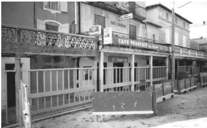
Fig. nº 50.— Presidencia de la plaza de toros de Marsillargues, Hérault (Montpellier) que se encuentra en la misma plaza del pueblo.