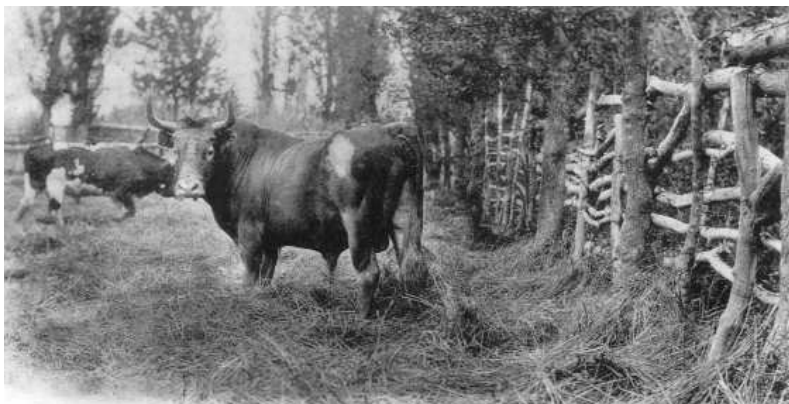
Fig. nº 48.— Toro de raza cruzada hispano-camarguesa del siglo XIX (Apud: Col. ODAC, Montpellier).