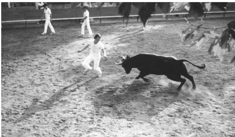
Fig. nº 45.— El raset , suerte clásica de la corrida camarguesa (Apud: Fot. de J. Roudil).

especificidad del contexto local: en la Provenza no era ni es el hombre sino el animal quien figura en el centro del juego taurómaco. El toro camargués, portador de cocardes , recompensadas con premios de orden económico u honorífico lo suficientemente valiosos como para estimular la codicia de los corredores — raseteurs (Fig. nº 45)— ávidos de ganancias, aparecía, ante los ojos del público, con la imagen de un