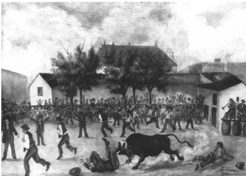
Fig. nº 42.— Corrida en un pueblo camargués a principios del siglo XX (Apud: Col. ODAC, Montpellier).

Una cultura taurina muy distinta a la de Portugal fue la que se impuso en España. En efecto, en este país, desde el punto de vista social, ocurrió todo lo contrario puesto que siempre, en la formación de la fiesta nacional , se ha podido destacar, como su fenómeno diferencial más representativo,