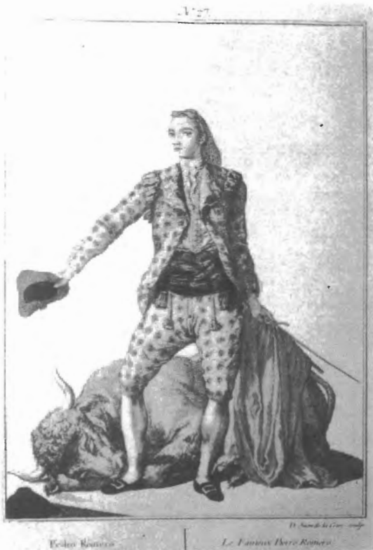
Fig. n.º 24.— Cano, Juan de la Cruz: Pedro Romero , grabado iluminado, Madrid, Museo Municipal.

dante, pronto empezaron los problemas. El más grave de todos fue el económico. Las ciudades que organizaban corridas no estuvieron en absoluto de acuerdo con las nuevas tasas para el sostenimiento del instituto sevillano por lo que, salvo escasísimas excepciones, recurrieron la decisión real y se negaron a pagar. Esto provocó que Arjona, el intendente de Sevilla, que era también juez protector de la Escuela, se viese obligado a afrontar los gastos con fondos procedentes en exclusiva de la ciudad de Sevilla pero, aun así, la cantidad era insuficiente para el funcionamiento de la institución. Junto a esto, en los primeros momentos de euforia se había decidido construir una plaza para la Escuela argumentando que la que había en el matadero no era adecuada, con lo cual se