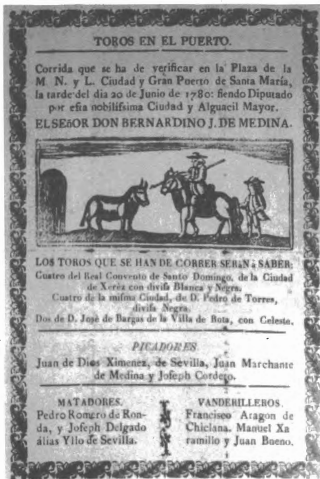
Fig. n.º 23.— Cartel de toros. Función de toros en el Puerto de Santa María anunciando a los matadores Pedro Romero de Ronda y José Delgado de Sevilla, 1780 (Apud.: Zaldívar, 1990: 116).