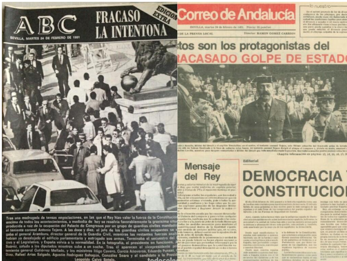
Collage en el que aparecen dos fotografías de las portadas de las ediciones publicadas el 24 de febrero de 1981, tanto en el ABC 39 como en El Correo de Andalucía 40 de Sevilla.

Ambas portadas son muy dispares, pues, como es deducible, cada una sigue la línea editorial y los códigos deontológicos de su medio. En el caso de la portada del diario ABC, que corresponde con la imagen de la izquierda, en este se decidió publicar una edición extra, para así informar, extensamente, de lo ocurrido. La cabecera de este se encuentra cubierta, en unas tres cuartas partes, por una fotografía en la que puede descubrirse, perfectamente el abandono de los Diputados y trabajadores del Congreso del mismo. La imagen va acompañada de un titular informativo, muy conciso pero, a la vez, bastante claro: “El fracaso de la intentona”. Además, a pie de página, rodeada por un recuadro de color oscuro, se incorporó una explicación y contextualización de la imagen, a modo de pie de fotografía, aunque un poco más extenso de lo normal.