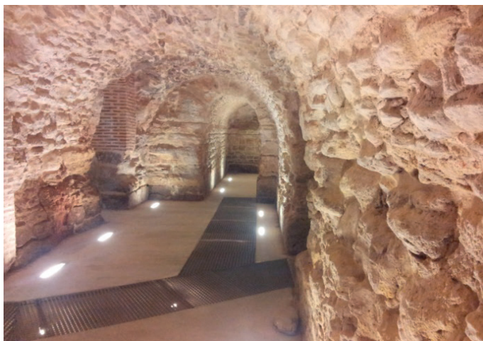
Figura 5. Criptopórtico.

Esta intensa actividad arqueológica ha dado lugar, como no podía ser de otra manera, al hallazgo de diversos epígrafes, algunos de los cuales ya fueron publicados por nosotros 11 , a los que añadimos en este artículo los tres siguientes: