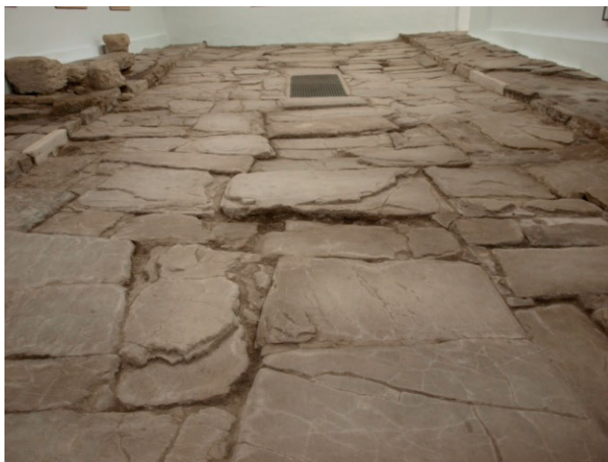
Figura 1. Tramo de cardo máximo de Asido .

de actuaciones arqueológicas, ya sea por la dinámica urbanística privada en edificios de nueva planta o por la ejecución de obras públicas que conllevan el control arqueológico en toda remoción de terreno 6 ; siendo la nota característica el impulso dado por las administraciones, en especial por la local, por actuar en espacios emblemáticos que han concluido con la puesta en valor y rentabilización social de lugares que pueden ser visitados por el público 7 , como el Conjunto Arqueológico Romano de la c/ Ortega nº 10-12, que se formó a partir del conocimiento de dos galerías de cloacas transitables descubiertas a finales de los años sesenta y la posterior adquisición por parte del Ayuntamiento de las dos fincas colindantes que, tras varias campañas de excavación, dejaron al descubierto un tramo de cardo , restos de viviendas y criptopórticos romanos, además de vestigios de un complejo alfarero almohade 8 . También se ha puesto en valor un tramo del cardo maximus 9 , varios lienzos y puertas del perímetro amurallado de la villa