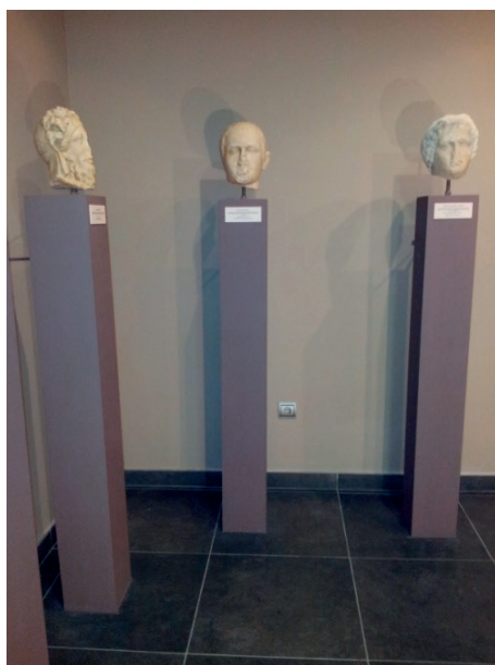
Figura 4. Esculturas romanas del MAMS.