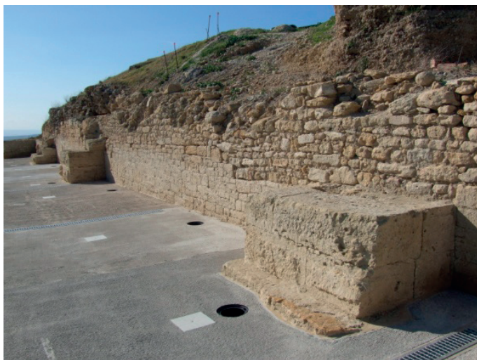
Figura 2. Muralla y torres- contrafuertes del castellum militar romano.

medieval y la recuperación de la Villa Vieja, un recinto amurallado con viviendas de los siglos XIII al XVI.