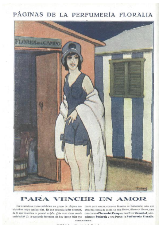
Figura 4: La Esfera , 4/08/1917

Este modo de elaborar el anuncio es propio de la publicidad artística que acostumbra a encargar, tanto el dibujo como el texto, a excelentes dibujantes y escritores dotados de una gran creatividad.