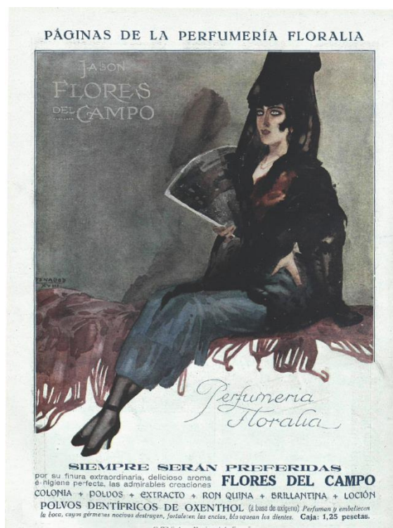
Figura 2: La Esfera , 25/05/1918

Además de los anteriores existen otro tipo de dibujos, sin escenario aparente, que evocan a la mujer española, hermosa, con clase, que despierta admiración por donde pasa; para representar este modelo femenino recurre al traje regional y a la mantilla en una exaltación del regionalismo hispano tan en boga en los artistas de la época. En este grupo se encuadran tres ilustraciones sobre fondo blanco, gris o negro que, por la postura de la protagonista, se asemejan a un retrato (figura 2).