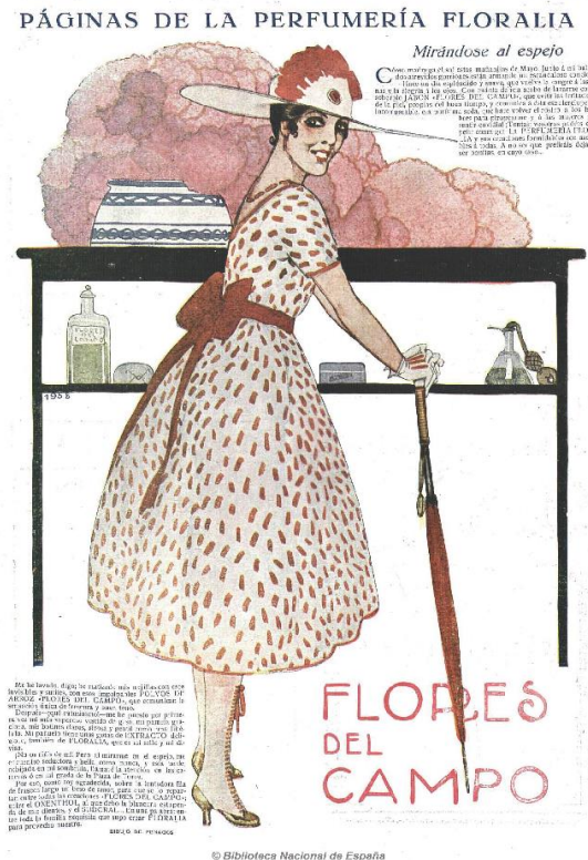
Figura 3: La Esfera , 16/06/1917

Finalmente, subrayar el carácter comercial de los dibujos, los productos de Floralia: jabones, colonias, polvos, etc., con presencia en el escenario del dibujo, en dos ocasiones llevan el nombre de la marca en los envases (figura 3), todo un guiño a la empresa para la que trabajaba.