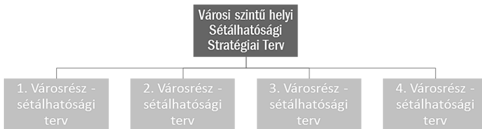
1. ábra A tervek hierarchiája egy nagyobb városban

A sétálhatósági tervezés folyamatának két fő szintje van: az egyik a városi szintű helyi sétálhatósági stratégiai terv elkészítése, mely az egész várost lefedi, és arra irányul, hogy az aktív közlekedési módok – elsődlegesen a gyalogos közlekedés – aránya növekedjen az autós közlekedés kárára (1. ábra). A helyi sétálhatósági stratégiai terv stratégiai keretet biztosít a gyalogosbarát fejlesztésekhez és kijelöli azokat a városrészeket, ahol ezeket a fejlesztéseket meg kell valósítani.