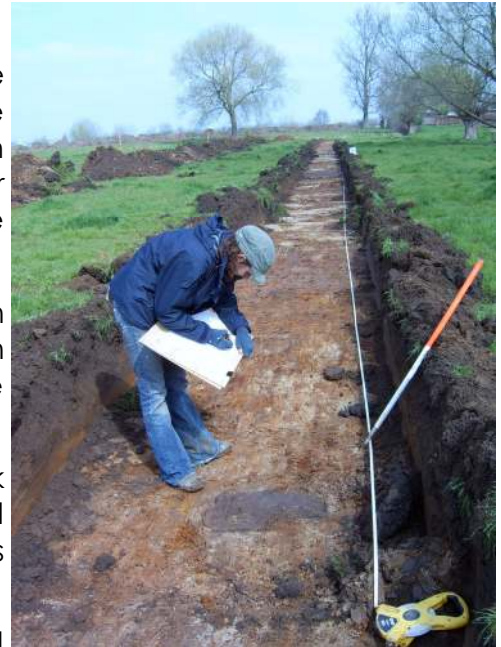
Fig. 16: Inventarisatie van de sporen in de proefsleuven te Evergem - Hoevestraat.

In een kijkvenster werd duidelijk dat het overgrote deel van de vermoede paalsporen eigenlijk natuurlijke sporen waren.