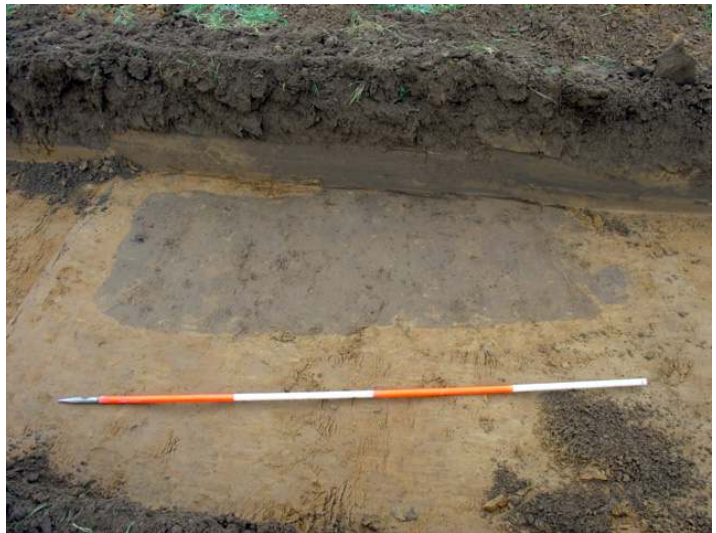
Fig. 8: Recente rechthoekige kuil op het terrein aan de Groenstraat, te Deinze - Bachte-Maria-Leerne .

Slechts één recente rechthoekige kuil werd aangesneden, en er werden slechts enkele verspoelde scherfjes gevonden. Een mogelijke verklaring voor het afwezig zijn van sporen is dat het terrein reeds te veel afhelt en daardoor minder goed werd bevonden voor occupatie.