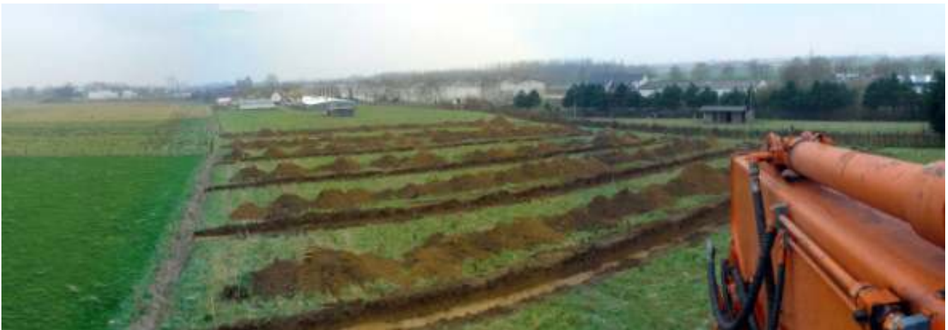
Fig. 9: Overzichtsfoto op het vooronderzoek met proefsleuven te Deinze - Bachte-Maria-Leerne Groenstraat.