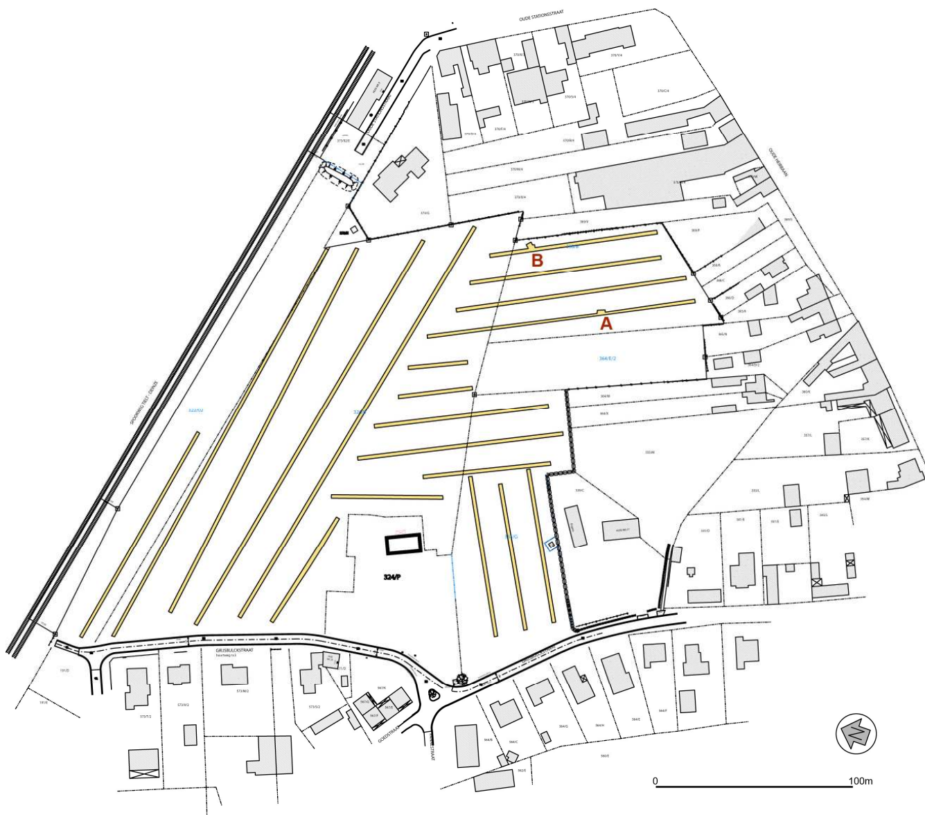
Fig. 10: Sleuvenplan van de nieuwe verkaveling Grijbsbulckstraat in Deinze - Grammene.

In deze sleuven werden in het overgrote deel van het terrein enkel recente resten aangesneden. Het gaat daarbij om vrij recente grachten, waaronder een gedempte gracht rond het boerderijgebouw. Eveneens werden er grachten met Raeren- en pijpvaardewerk aangetroffen. Uit WOII stamde een obus die door DOVO ter plekke onschadelijk diende gemaakt te worden. Twee structuren in het oostelijk deel van het terrein werden door middel van kleine kijkvensters verder onderzocht. Net in dit oostelijke deel