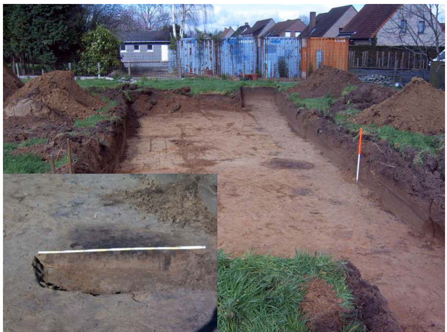
Fig. 13: Kijkvenster op één van de proefsleuven te Deinze - St. -Martens - Leerne Damstraat, met de coupefoto van de kuil als inzet.

In het deel van het perceel tegen de Damstraat werden enkel wat recente kuilen aangetroffen. Tegen de perceelsgrens werden wel een viertal paalsporen en een grote kuil aangetroffen. Deze sleuf werd uitgebreid met twee kijkvensters die echter geen nieuwe sporen opleverden. De kuil was rond in doorsnede met een diameter van ongeveer 1 m. Dit spoor was slechts een 5 à 10-tal cm diep bewaard en in de vulling werden enkele silexfragmenten en wat prehistorisch aardewerk aangetroffen. Als er een mogelijke nederzetting in de buurt is, dan valt deze grotendeels buiten het bedreigde perceel, de aangetroffen sporen kunnen op de grens zitten of behoren tot de periferie.