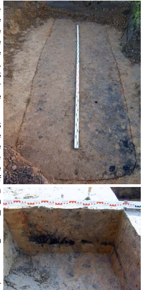
Fig. 12: Overzichtsfoto en coupefoto van het rechthoekig spoor.

Gezien de beperkte aanwezigheid van sporen werd geen vervolg aan het onderzoek gebreid.